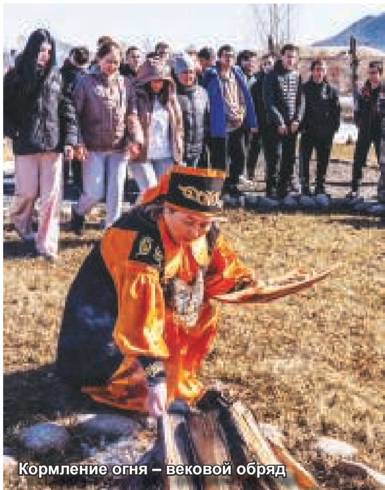
Кормление огня – вековой обряд

Пятничный день в Таштыпе ознаменовался ярким и запоминающимся празднованием Чыл Пазы – одним из важнейших событий в календаре хакасского народа, праздничная атмосфера царилла на гостеприимной площадке «Изенер – Добро пожаловать!». Жители Таштыпского района и многочисленные гости собрались, чтобы отметить наступление весны и начало нового сельскохозяйственного сезона. Чыл Пазы, традиционно приуроченный ко дню весеннего равноденствия, символизирует пробуждение природы, конец суровой зимы и надежду на обильный урожай. Воздух наполнялся ароматами пробуждающейся земли, предвкушением тёплых солнечных дней и радостных хлопот на земле.