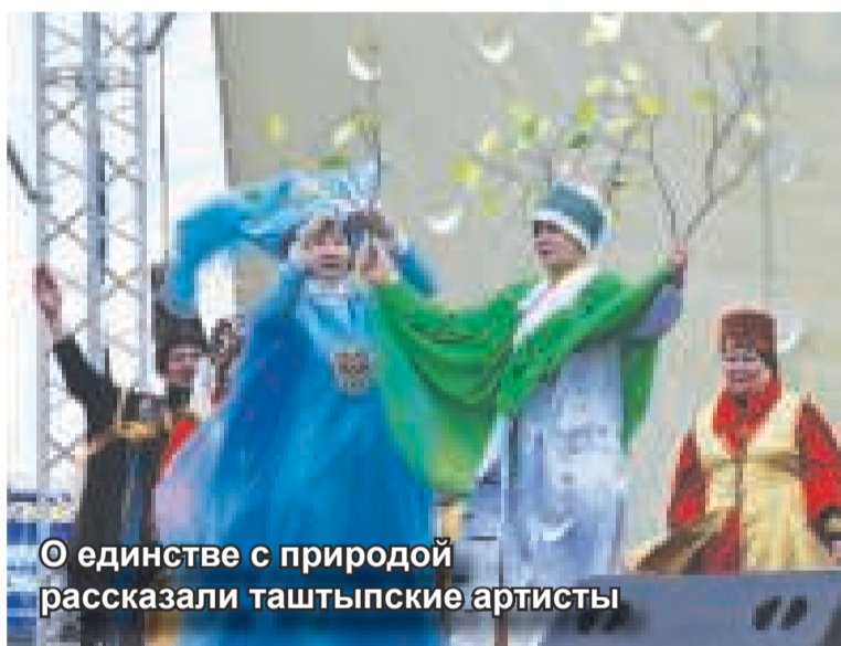
О единстве с природой рассказали таштыпские артисты