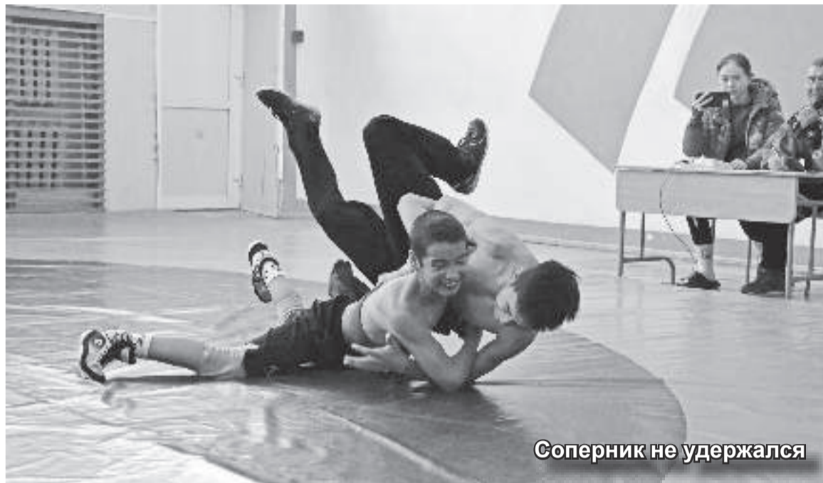
Соперник не удержался