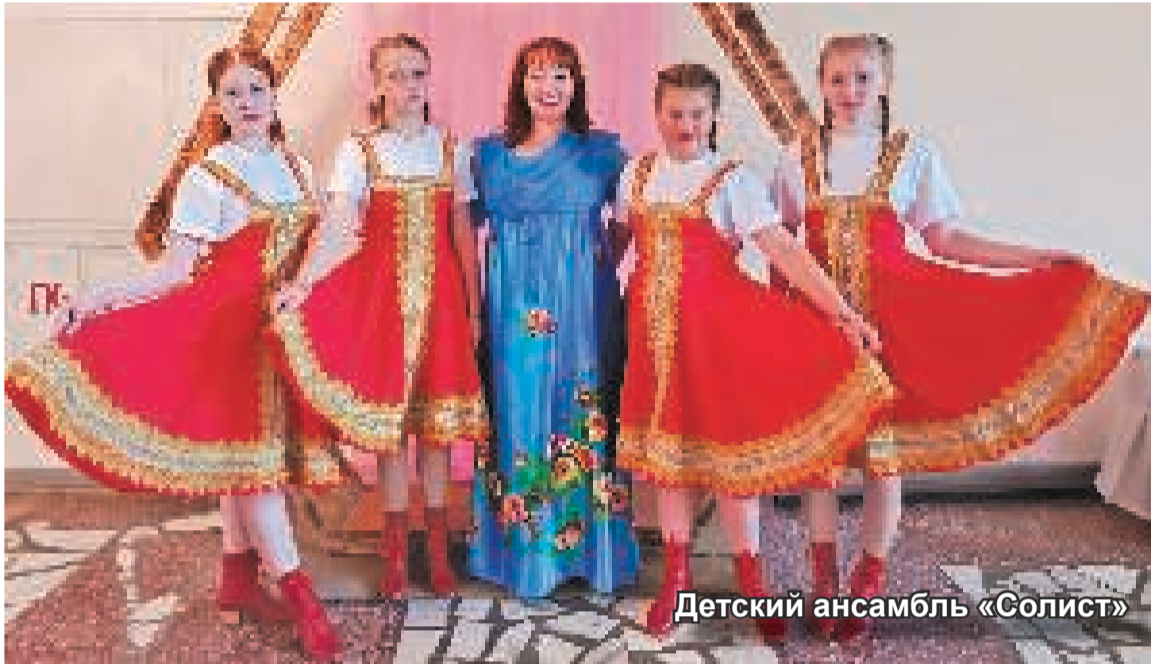
Детский ансамбль «Солист»