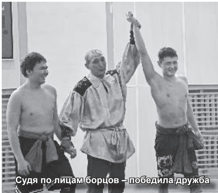
Судья по лицам борцов – победила дружба