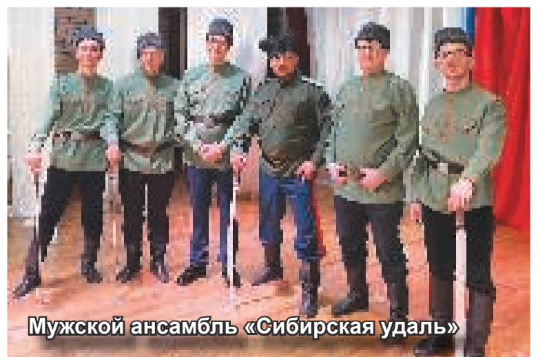
Мужской ансамбль «Сибирская удаль»