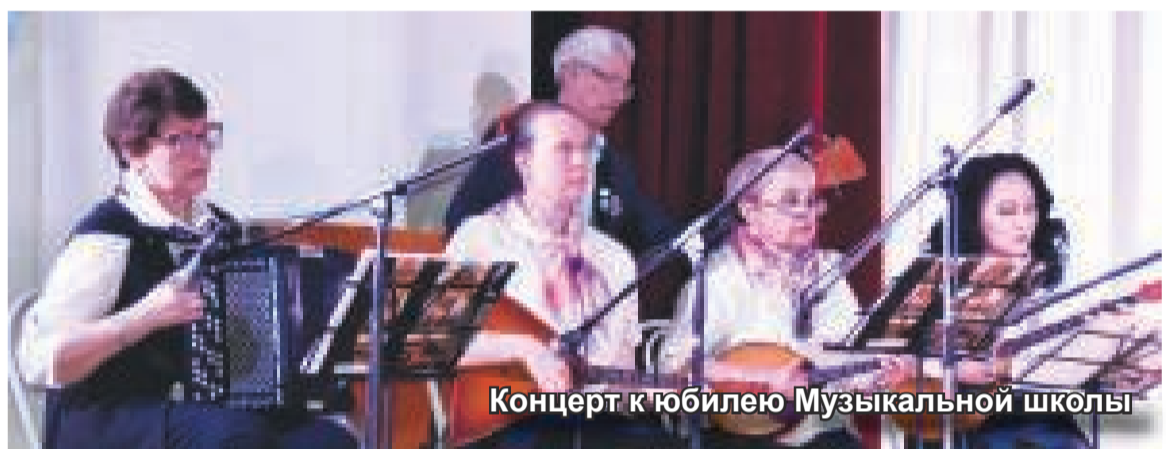
Концерт к юбилею Музыкальной школы

В 2024 году состоялись образовательные и просветительские мероприятия, посвященные Году семьи в контексте местной культуры, а также мероприятия духовно-патриотического содержания,