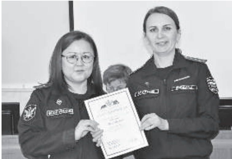
В администрации Таштыпского района структурные подразделения службы судебных приставов выступили с итоговыми докладами за 2024 год.

Результаты проделанной работы представили Таштыпское, Аскизское районные отделения службы судебных приставов и Абазинское городское отделение службы судебных приставов.