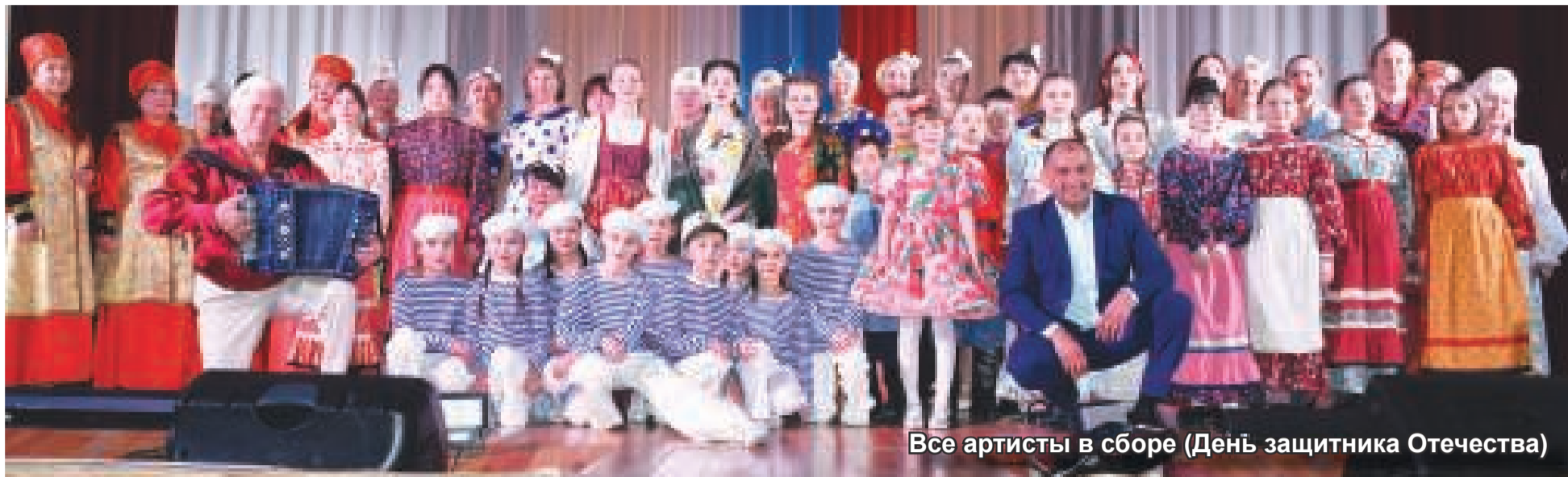
Все артисты в сборе (День защитника Отечества)

Ведущим направлением управления культуры Таштыпского района было и остается сохранение и развитие культурного наследия и потенциала. О том, каким был 2024 год для этой важной сферы в нашем материале.