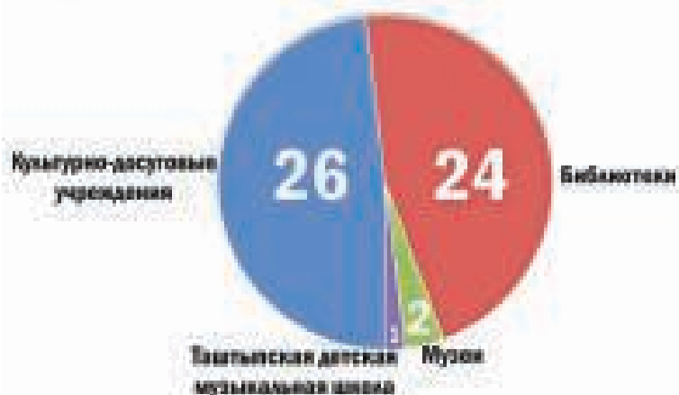
Количество учреждений культуры в районе

Таштыпская межпоселенческая библиотечная система (далее ТМБС) отметила своё 45-летие в 2024 году. За прошедший год проведено 1125 мероприятий, это на 12% больше, чем за аналогичный период 2023 года. Общее число посещений возросло на 16% в сравнении с 2023 годом и составило 136002 человека. Благодаря проекту «Пушкинская карта» удалось привлечь больше посетителей, предлагая читателям старше 14 лет разнообразные меро-