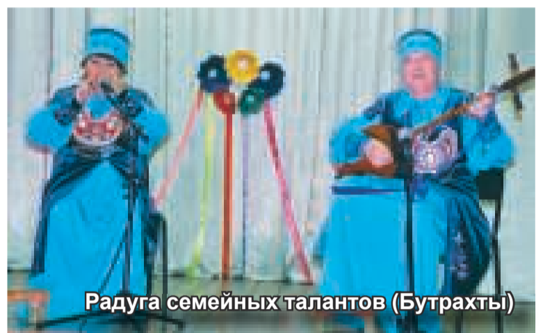
Радуга семейных талантов (Бутрахты)

Преподаватели и воспитанники регулярно принимают участие в конкурсах, фестивалях, олимпиадах муниципального и регионального уровня. За прошедший год школой проведено 22 мероприятия, в том числе выездных.