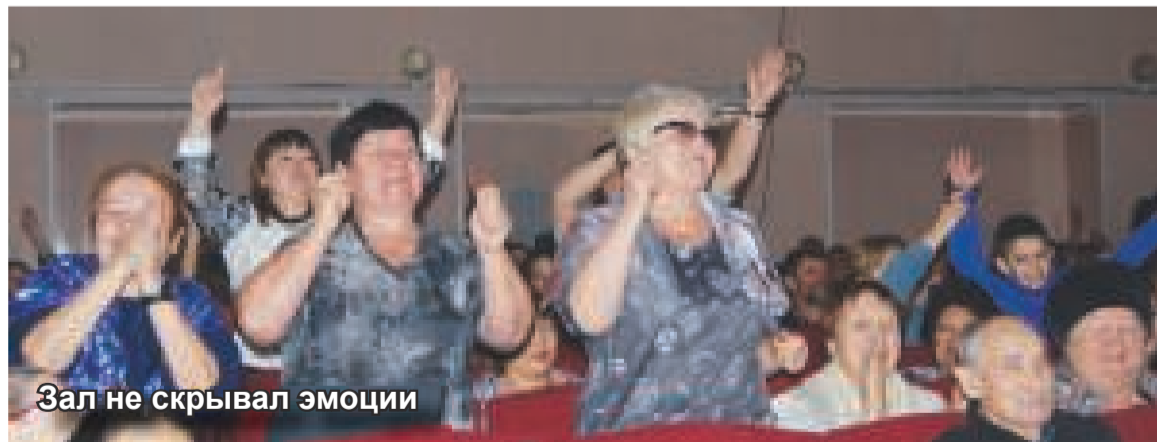
Зал не скрывал эмоции