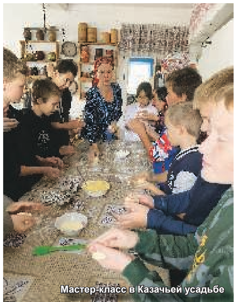
Мастер-класс в Казачьей усадьбе