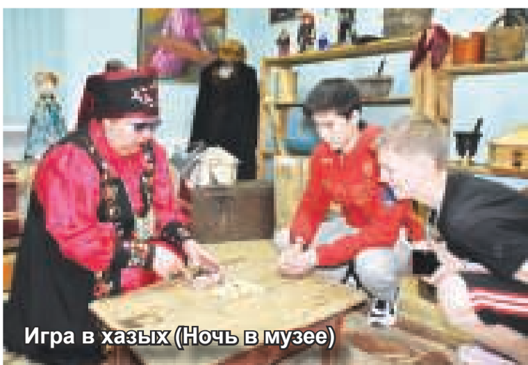
Игра в хазык (Ночь в музее)