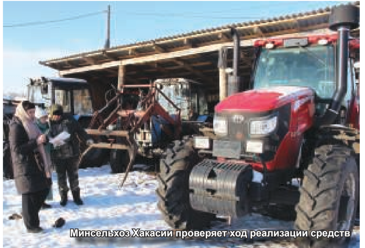
Минсельхоз Хакасии проверяет ход реализации средств

Есть ещё два условия: хозяйство или его глава ранее не