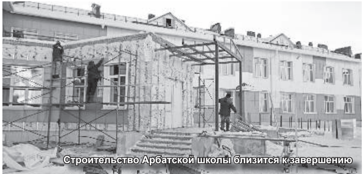
Строительство Арбатской школы близится к завершению