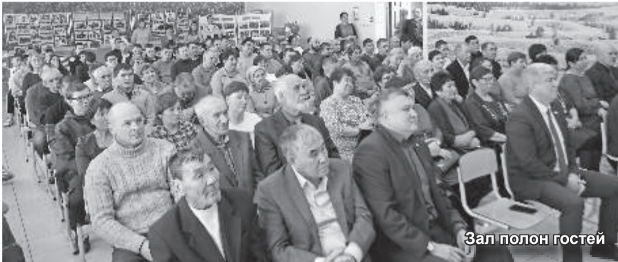
Зал полон гостей

Так можно сказать о тружениках сельского хозяйства Таштыпского района. В минувшую пятницу состоялось торжественное чествование этих выдающихся людей. Более 70 человек были удостоены почетных наград от: Министерства сельского хозяйства Республики Хакасия, Главы Таштыпского района, Верховного Совета Республики Хакасия и Совета депутатов Таштыпского района.