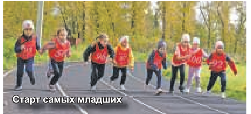
Старт самых младших