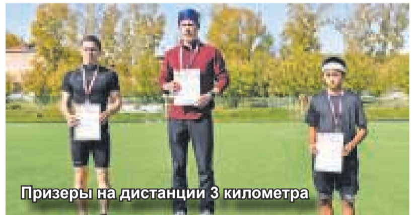
Призеры на дистанции 3 километра