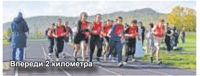
Впереди 2 километра

По итогу можно сказать следующее: сенсаций никаких нет – занимаешься физкультурой и спортом – занимаешь призовые места!