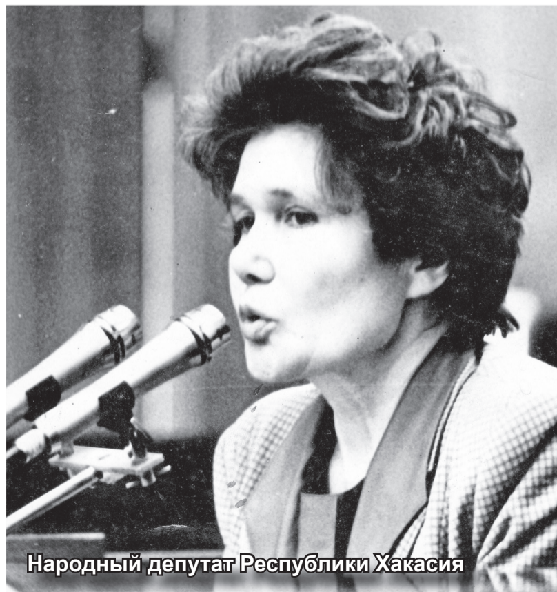
Народный депутат Республики Хакасия