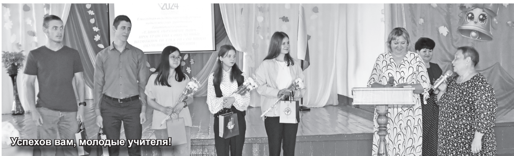
Успехов вам, молодые учителя!