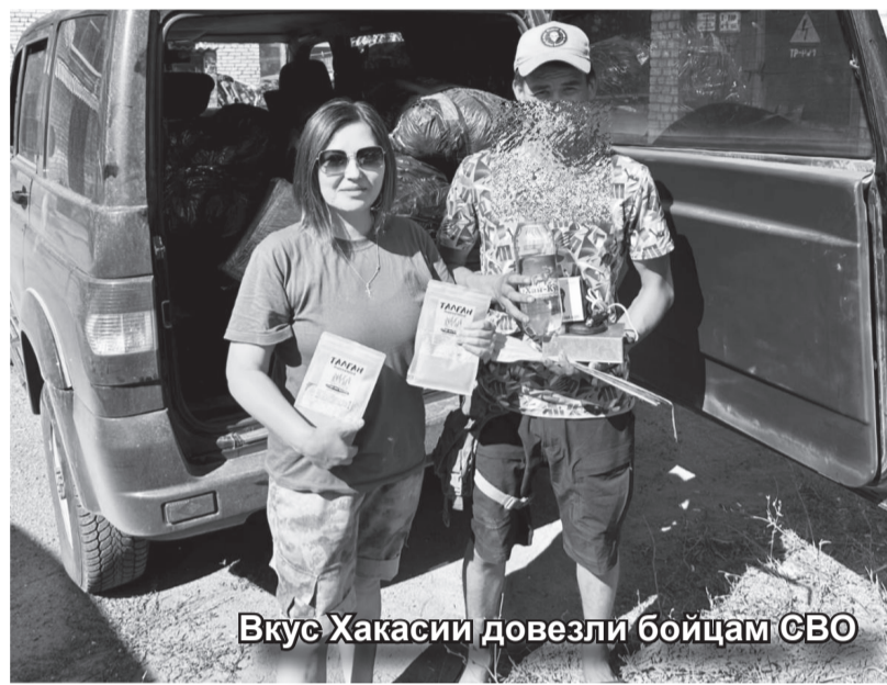
Вкус Хакасии довели бойцам СВО