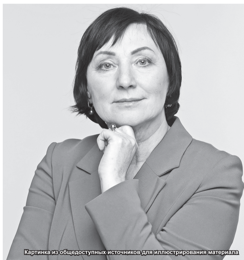
Картинка из общедоступных источников для иллюстрирования материала

но в прямом смысле прикоснуться к ней, познать ее суть.