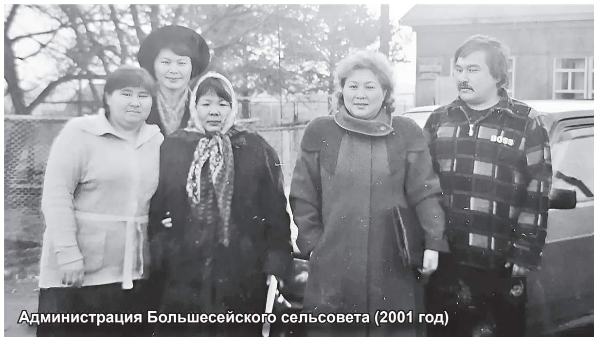
Администрация Большеесейского сельсовета (2001 год)