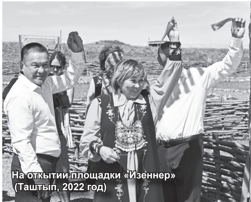
На открытии площадки «Изеннер» (Таштып, 2022 год)

Помните, я говорила о толерантности? Племянник женился на русской девушке, у племянниц мужья русские. А это значит одно – Хакасия наш общий дом и мы все одна большая семья. Семья, в которой все друг друга ценят и уважают.