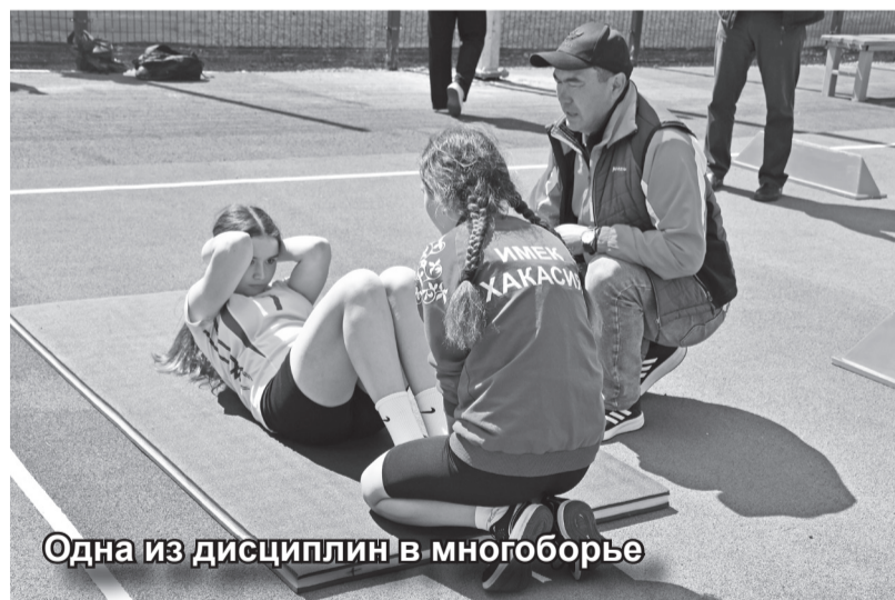
Одна из дисциплин в многоборье