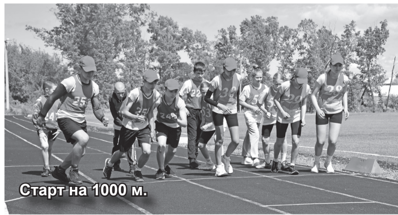
Старт на 1000 м.