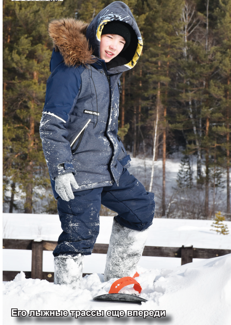
Его лыжные трассы еще впереди