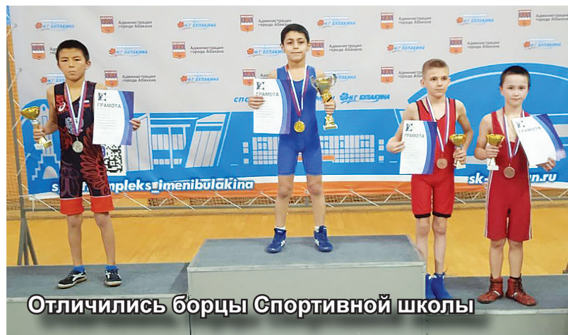
Отличились борцы Спортивной школы

В туристическом комплексе «Сюгеш» прошли соревнования по горнолыжному спорту и сноу-