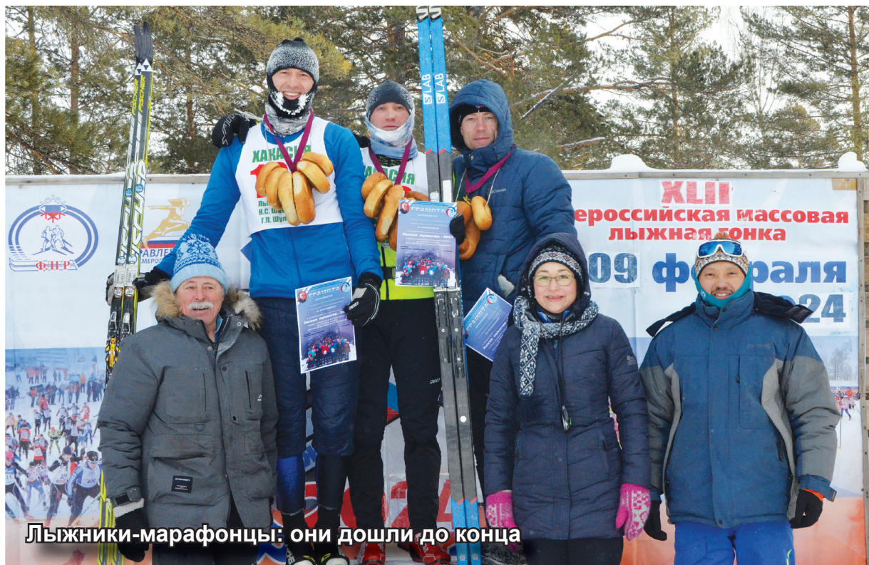
Лыжники-марафонцы: они дошли до конца