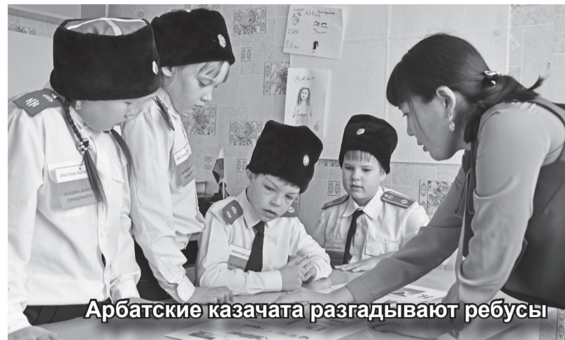
Арбатские казачата разгадывают ребусы