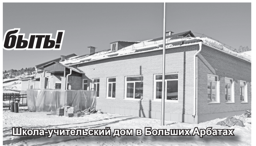
Школа-учительский дом в Больших Арбатах