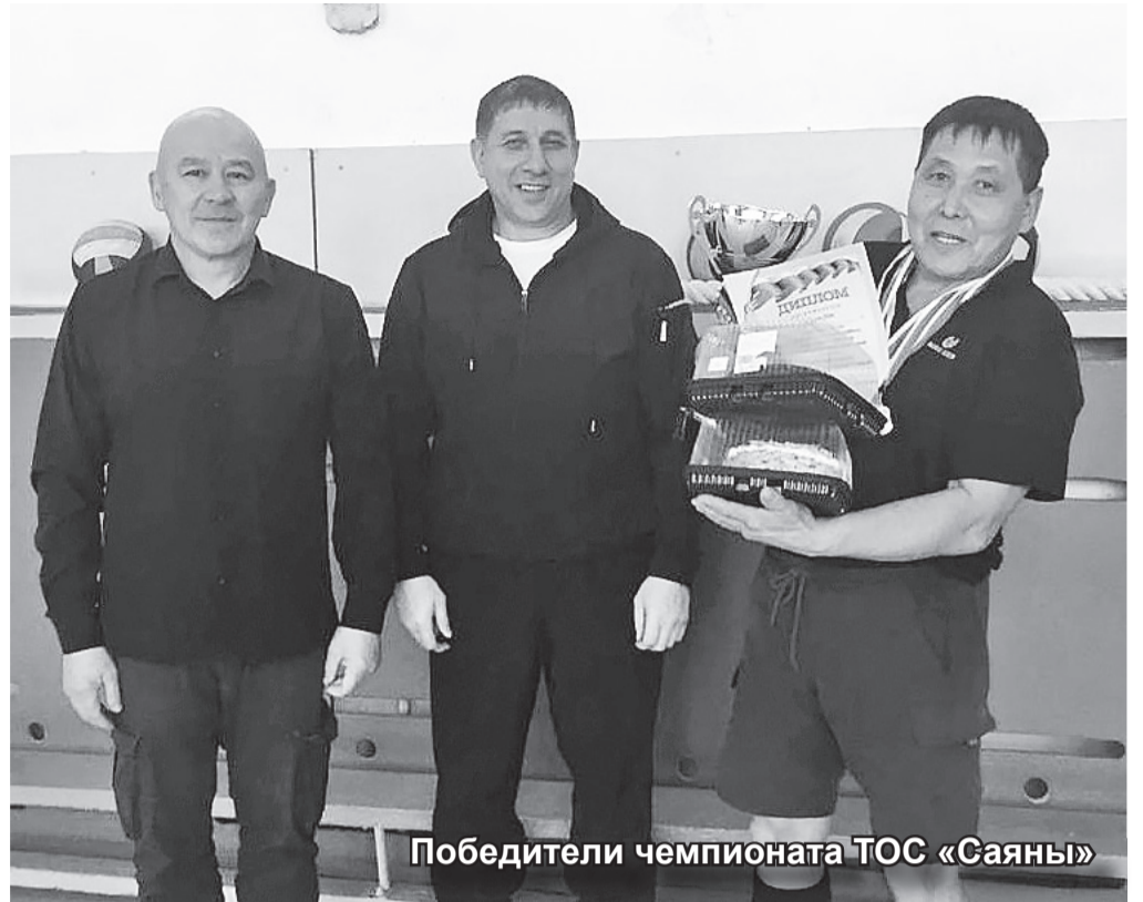
Победители чемпионата ТОС «Саяны»