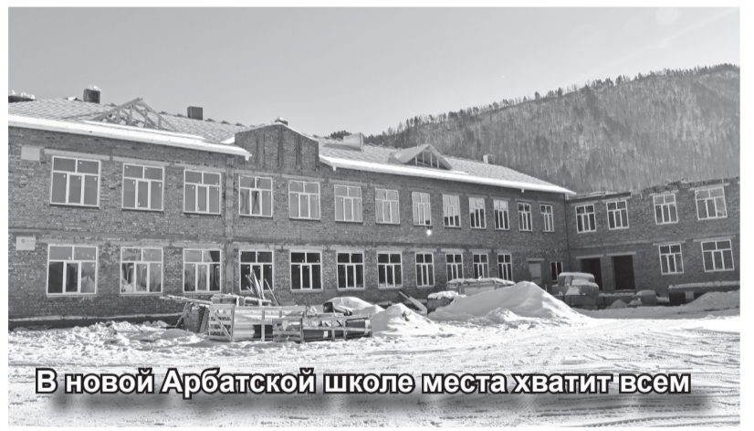
В новой Арбатской школе места хватит всем