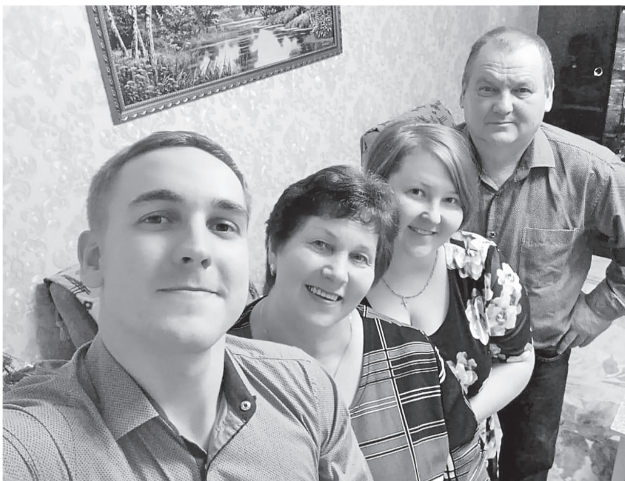
Семья Лифанских в сборе

«Слава Богу!» – было первой мыслью, когда он вернулся в Союз после демобилизации. Та