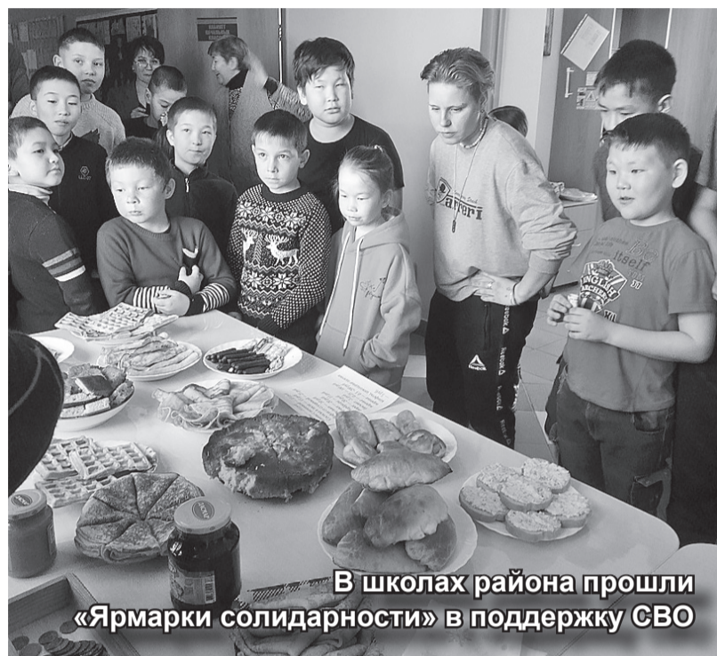
В школах района прошли «Ярмарки солидарности» в поддержку СВО

Лекарства: обезболивающие, противоожоговые, антигистаминные, активированный уголь, стерильные салфетки, гемостатические губки, бинты, широкие пластыри, кровоостанавливающие жгуты Эсмарха или турникеты, средство для обеззараживания воды, антисептики, перекись водорода, противогрибковые препараты, капельницы и шприцы, леденцы для горла.