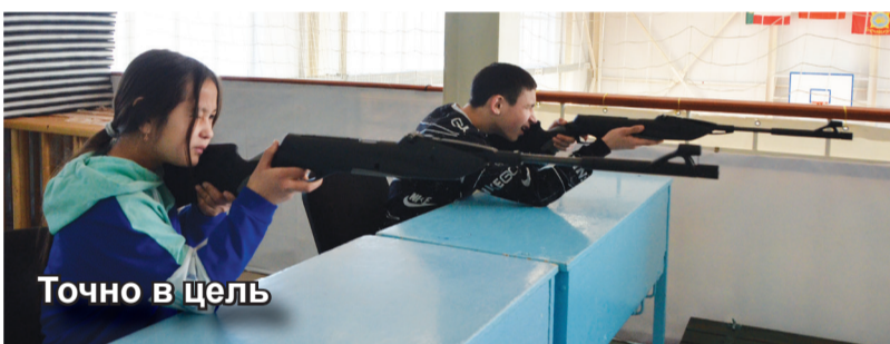
Точно в цель