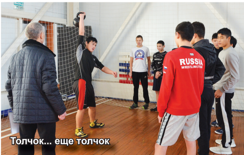
Толчок... еще толчок

есть золотой знак. Больше всего я люблю сдавать пресс и прыжки. Хочу, чтобы только они и были!