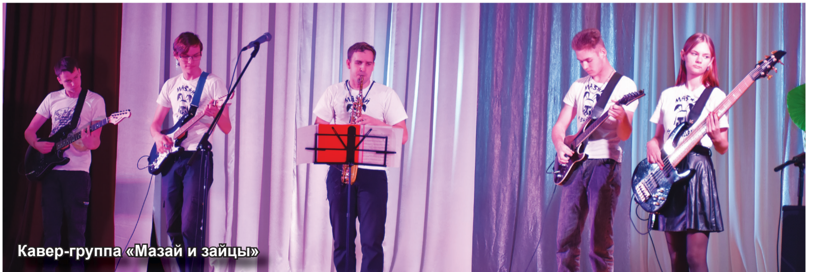
Кавер-группа «Мазай и зайцы»