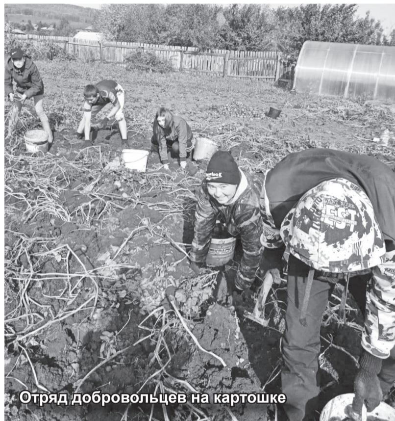
Отряд добровольцев на картошке

Председатель Совета депутатов Таштыпского района