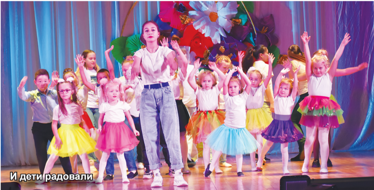
И дети радовали

Концерт ко Дню матери, который прошел в районном Доме культуры был пронизан одной эмоцией – любовью! Ее дарили артисты, подготовившие концерт, а те, кто его смотрел, принимали и возвращали сторицей!