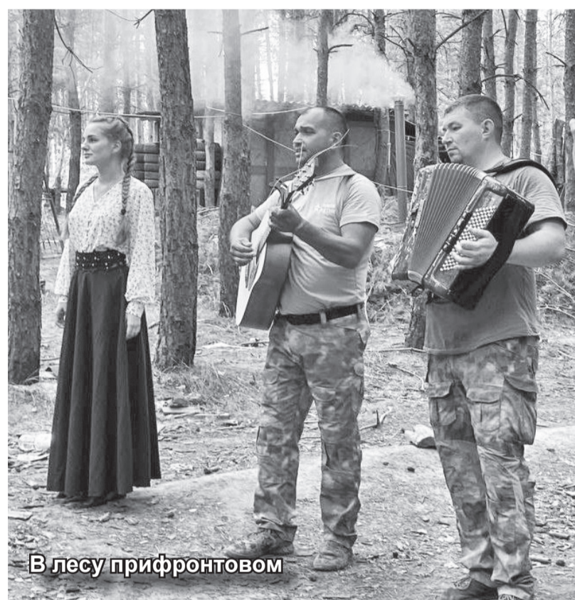
В лесу прифронтовом

– Мы же не дети. Все всё понимали. Но нам дорогу разъясни-