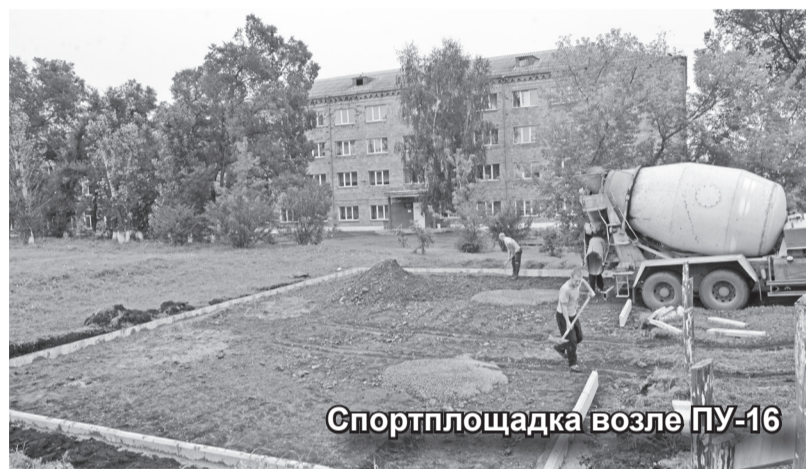
Спортплощадка возле ПУ-16

Также на территории спорткомплекса им. В.В. Майнагашева завершается строительство мини-футбольной и волейбольной площадок. Работы ведутся в рамках реконструкции стадиона «Урожай». Напомним читателям, что модернизация началась в 2015 году и проводилась в несколько