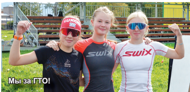
Мы за ГТО!

Программа пользуется большой популярностью среди студентов и школьников. Заветный золотой значок может дать много плюсов в будущем при поступле-