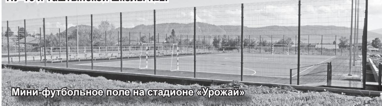
Мини-футбольное поле на стадионе «Урожай»

С понедельника началось строительство спортивных площадок на территориях ПУ-16 и Таштыпской школы №2.