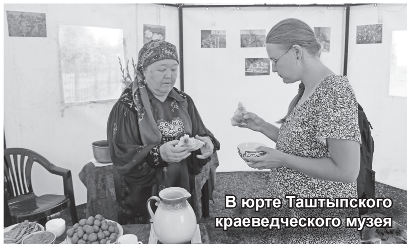
В юрте Таштыпского краеведческого музея