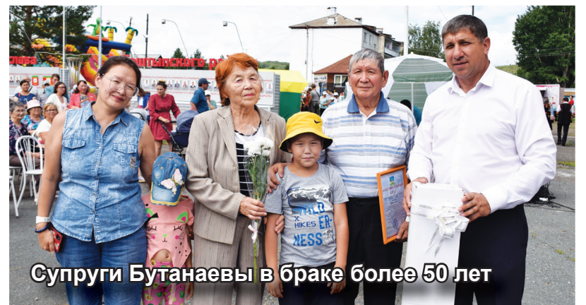
Супруги Бутанавы в браке более 50 лет