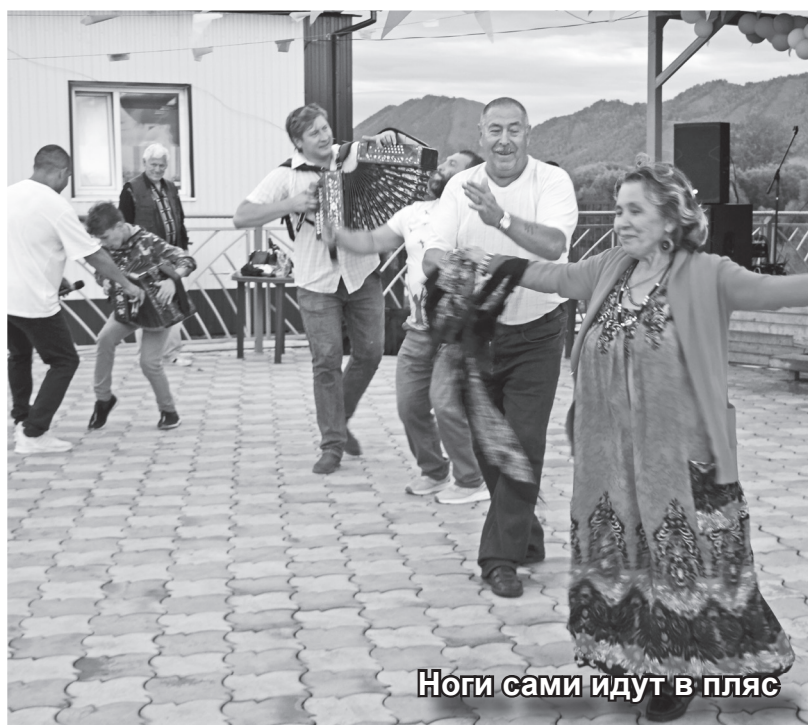
Ноги сами идут в пляс

В то время, когда на площади возле районного Дома культуры в торжественной обстановке чествовали лучших тружеников райцентра, работали различные площадки: торговые, развлекательные, творческие.