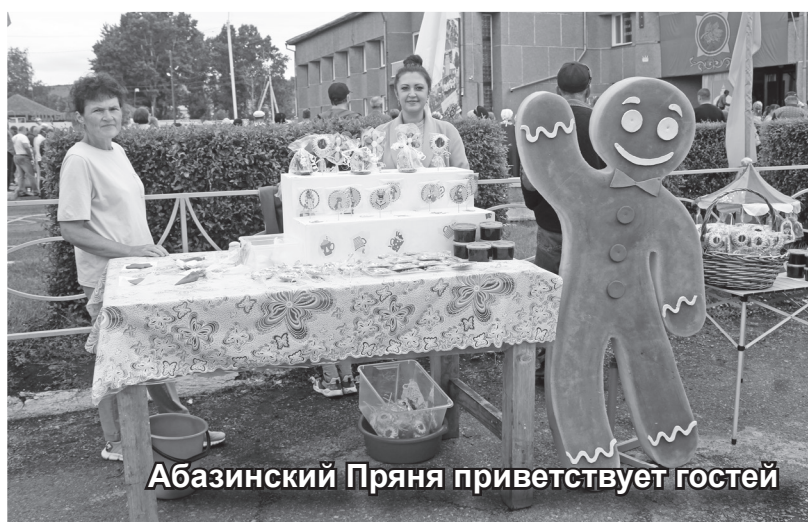
Абазинский Пряня приветствует гостей