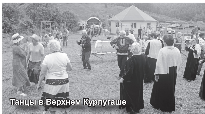
Танцы в Верхнем Курлугаше