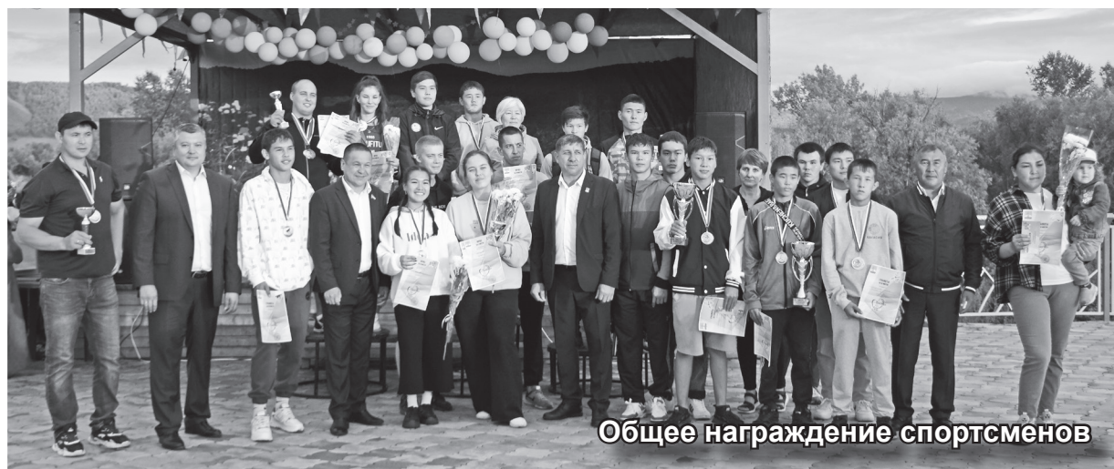
Общее награждение спортсменов