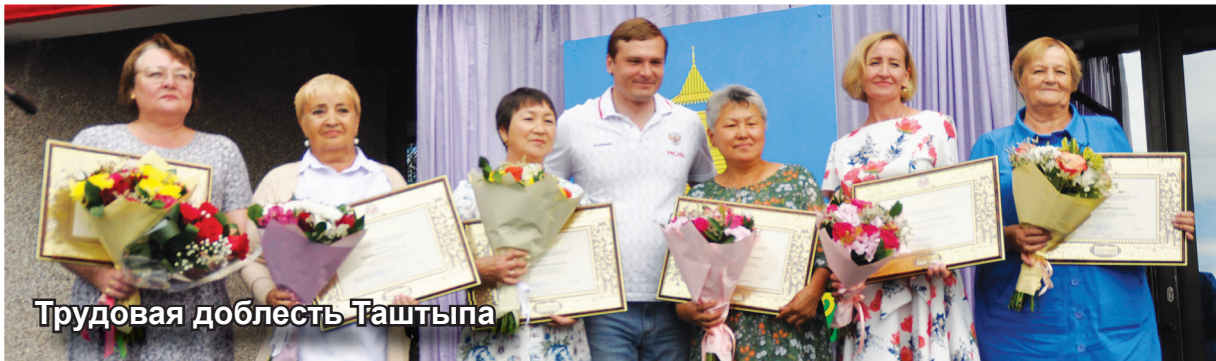
Трудовая доблесть Таштыпа

Яркий, красочный, масштабный, это все о нем, о прошедшем юбилее села Таштып.