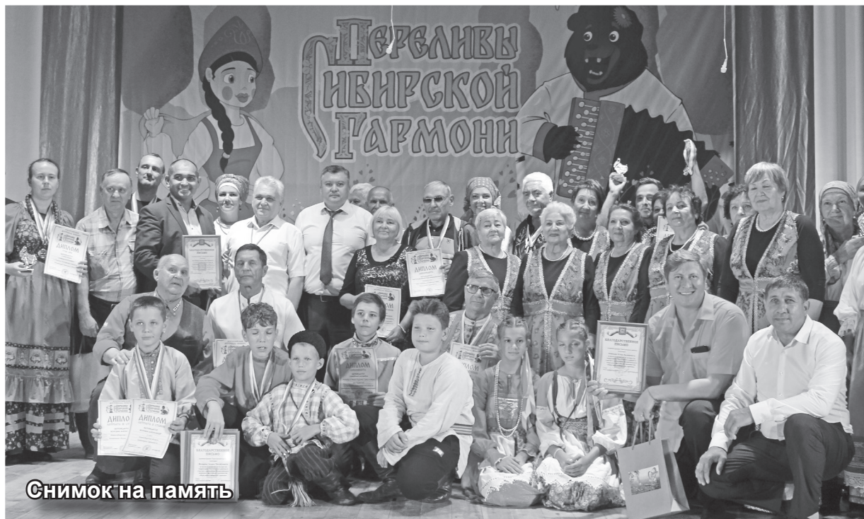
Снимок на память