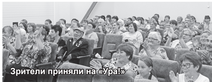
Зрители приняли на «Ура!»