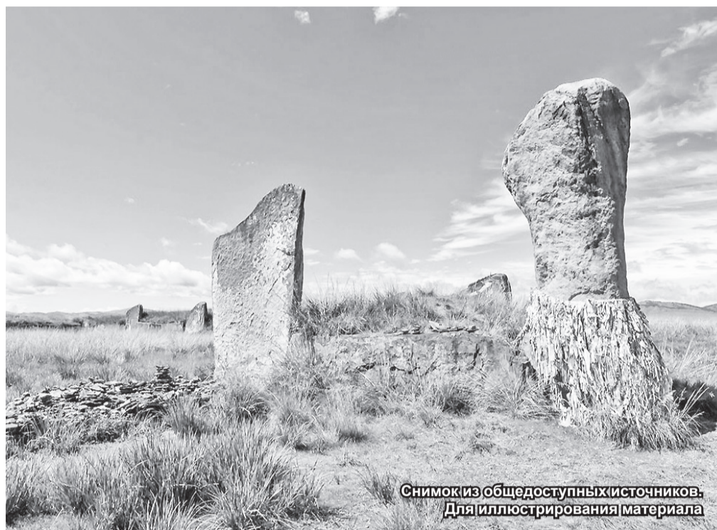
Для иллюстрирования материала

Менгир – «длинный камень», один из видов мегалитических построек – вертикально поставленные большие неотесанные продолговатые камни, разной величины, стоящие отдельно или составляя длинные аллеи или кольцевые ограждения.