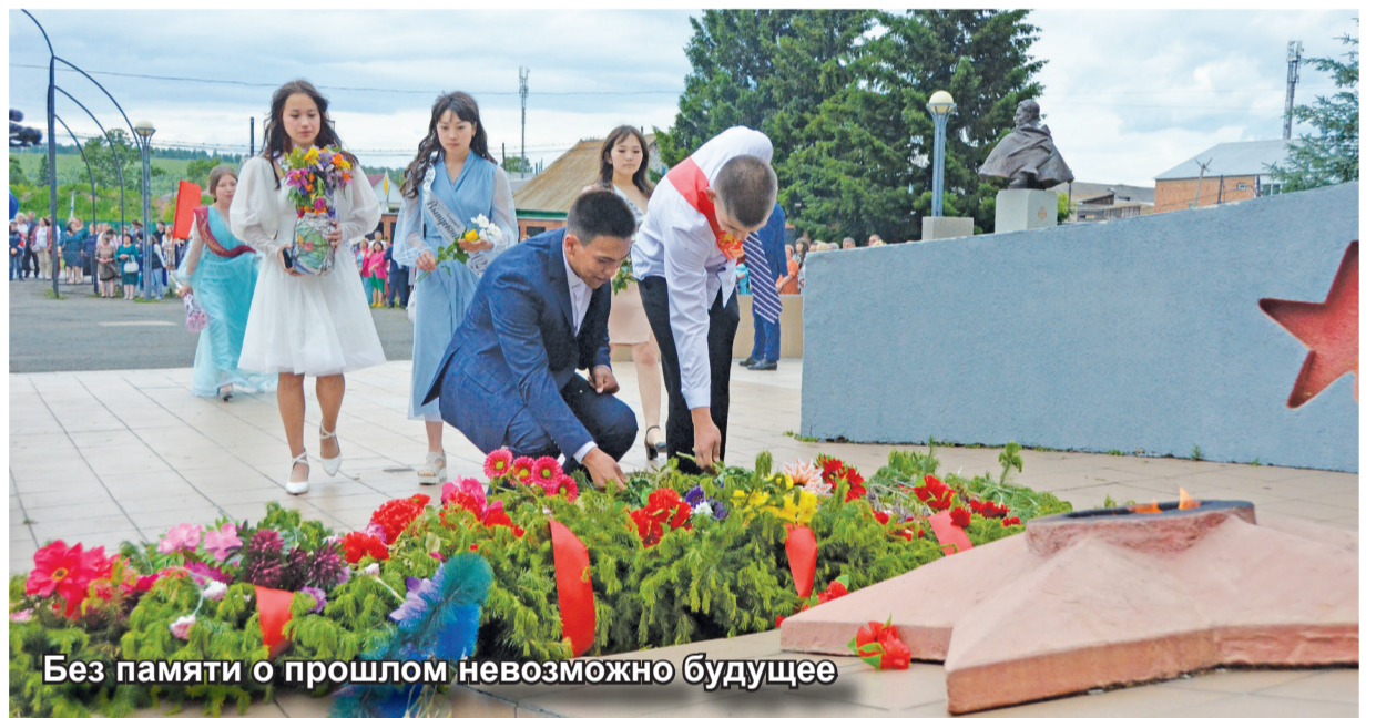
Без памяти о прошлом невозможно будущее