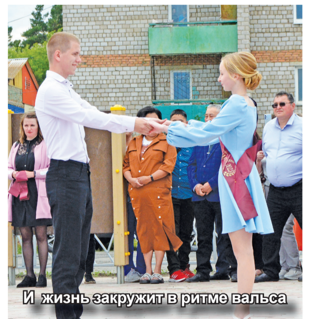
И жизнь закружит в ритме вальса