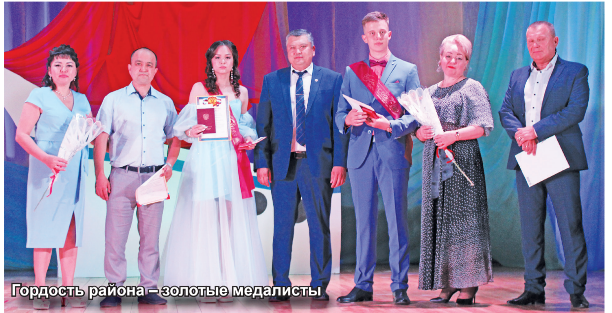
Гордость района – золотые медалисты