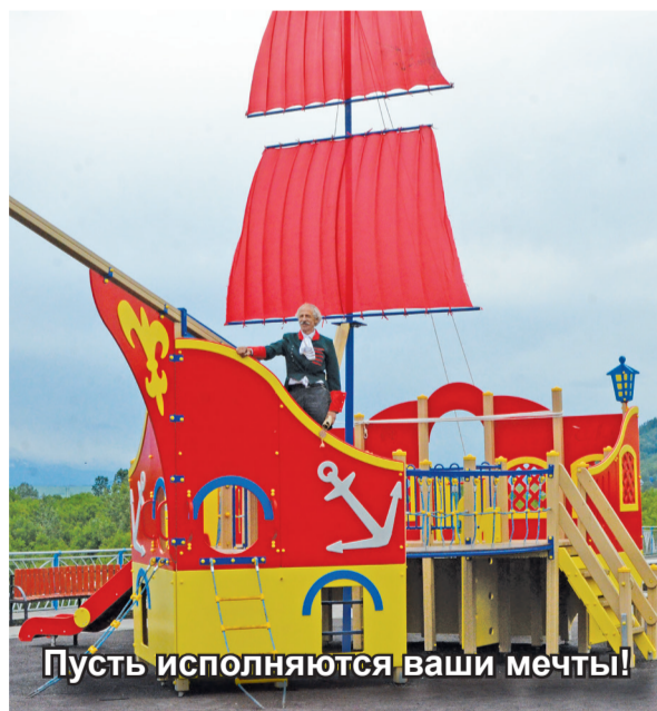
Пусть исполняются ваши мечты!