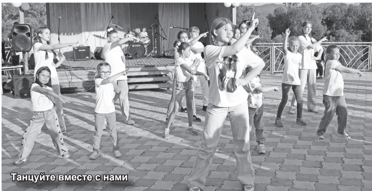
Танцуйте вместе с нами

В Таштыпе отметили День молодёжи. Во вторник на набережной развернулись праздничные мероприятия, в которых мог принять участие любой желающий.