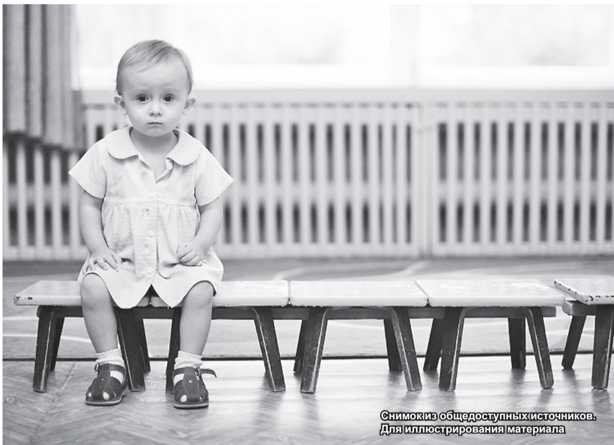
Снимок из общедоступных источников. Для иллюстрирования материала

История маленького Димки началась грустно – мама отказалась от него в роддоме. Почему? Этого никто не знает. Работники роддома и сами были очень удивлены: вот от кого, от кого, но от этой молодой, ухоженной, обеспеченной женщины они этого