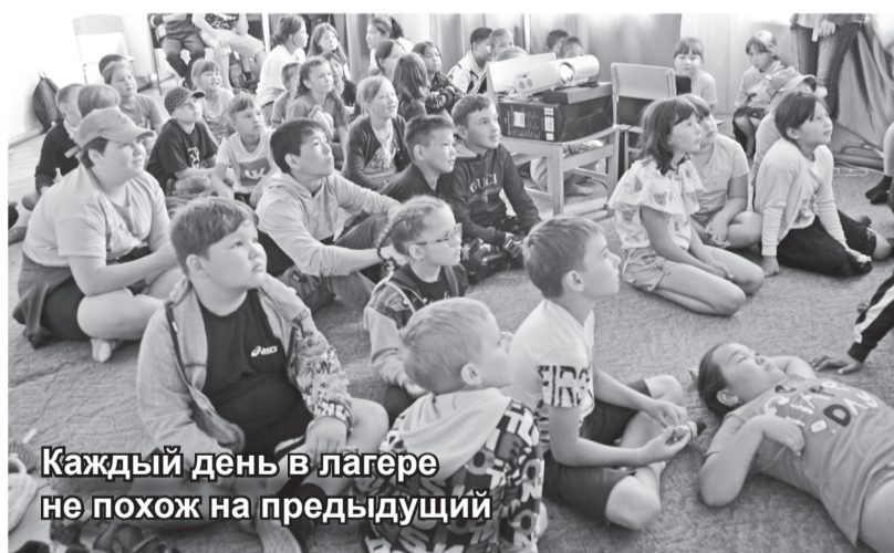
Каждый день в лагере не похож на предыдущий