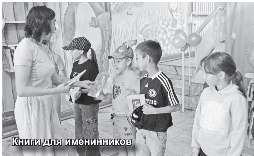
Книги для именинников

17 июня в Таштыпском Центре детского творчества состоялось закрытие смены летнего лагеря «Дружба». В течение трёх недель ребята играли, развивались и учились новому.