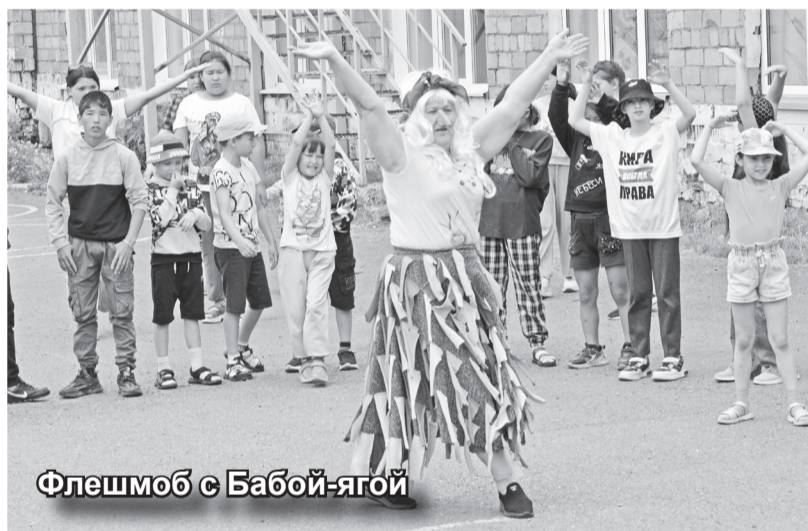
Флешмоб с Бабой-ягой