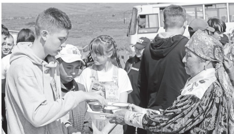
Чиланы встречали гостей травяным чаем