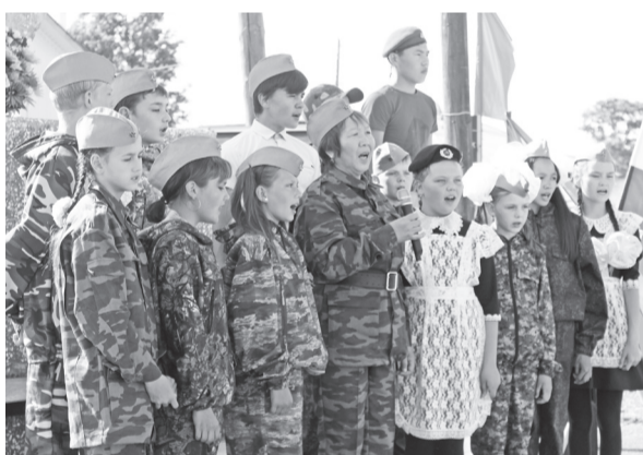
Песня в исполнении имекцев