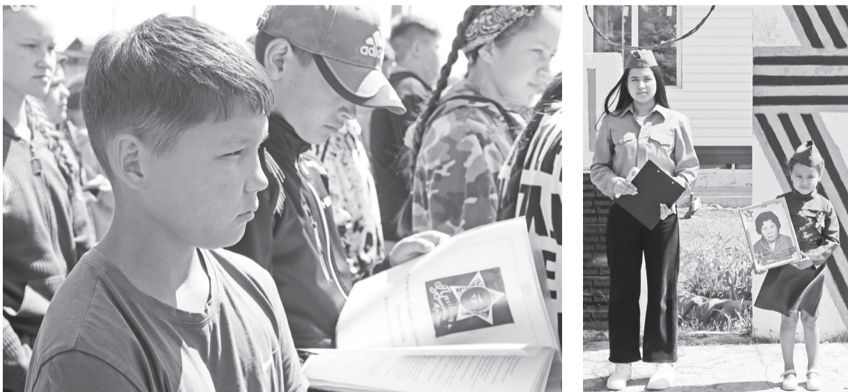
И пусть о войне дети знают только по книжкам