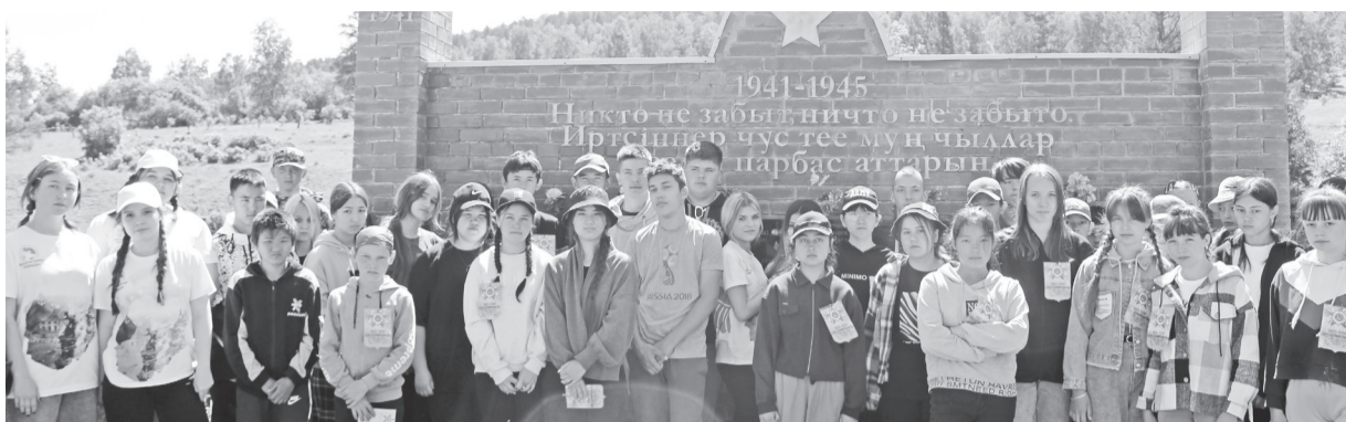
Возле памятника фронтовикам в Кызылсуге

А сегодня они смотрели киноленту, фильм-легенду, фильм, без которого невозможно представить наш кинематограф, – «В бой идут одни старики». И глядя на уставшие, но довольные лица детей хотелось лишь одного – пусть всегда будет мирное небо над их головами. Пусть!