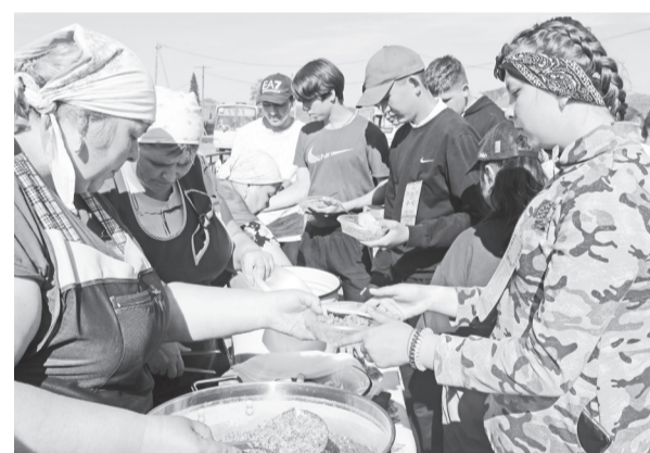
Эх, хороша каша, да ложка мала