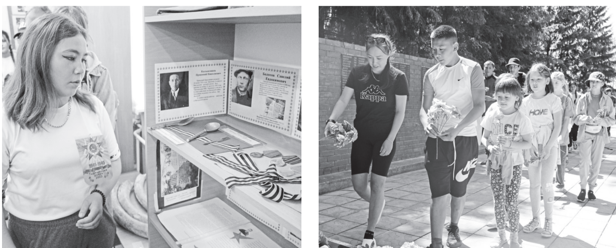
В Матурском музее