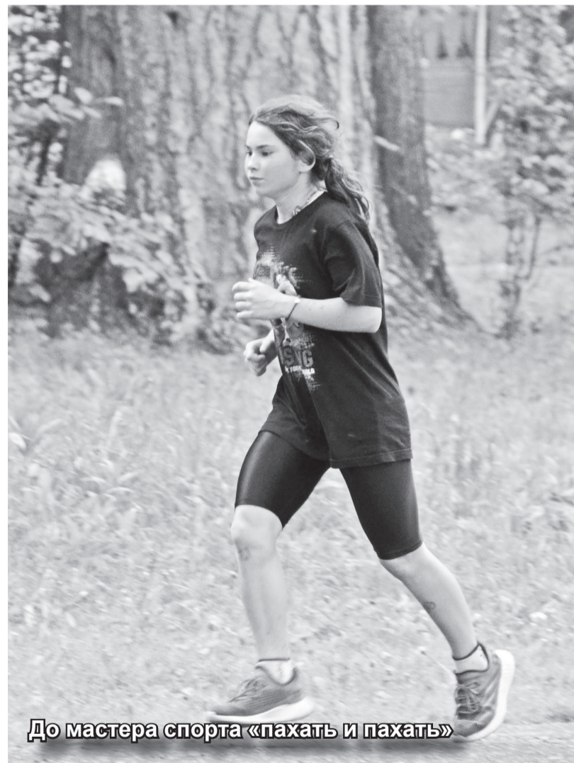
До мастера спорта «пахать и пахать»

Заканчивается первая смена отдыха детей в детском оздоровительном лагере «Серебряный ключ». С 10 по 30 июня двести школьников со всех уголков Хакасии напитываются новыми впечатлениями и положительными эмоциями, приобретают друзей, получают полезные социальные навыки, набираются сил к предстоящему учебному году.