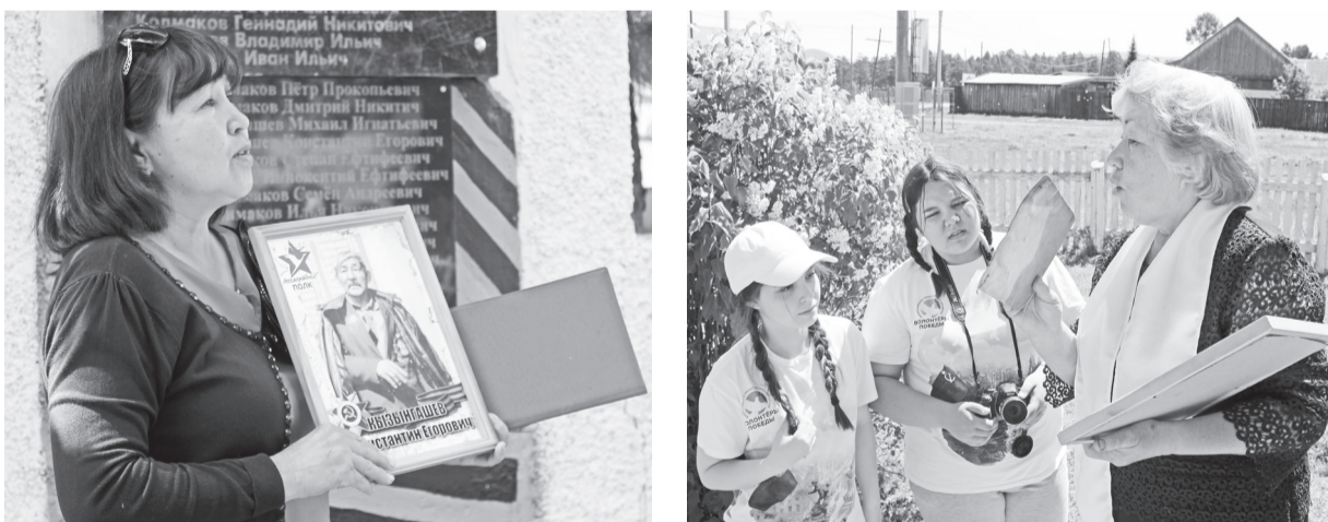
Со старых, пожелтевших фотографий глядят на нас фронтовики