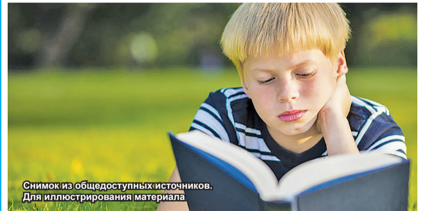
Снимок из общедоступных источников. Для иллюстрирования материала

Новинки художественной литературы – самая ценная добыча для любого читателя, но сегодня Центральная библиотека предлагает обратиться не к новым, а незаслуженно забытым книгам.