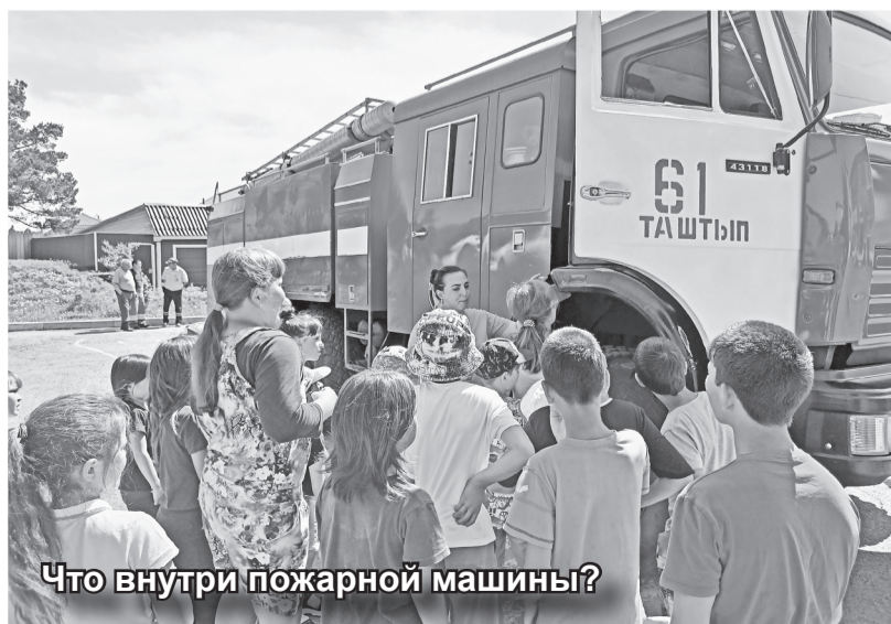
Что внутри пожарной машины?

Летний оздоровительный лагерь ЦДТ открыл свои двери 27 мая, его воспитанниками стали 60 детей разных возрастов. Ребята сформировали три отряда: «Акулы», «Одуванчики», «Лампочки», и придумали свои девизы. В течение всей смены они были вовлечены в калейдоскоп событий, и каждый день был не похож на предыдущий – наполнен новыми впечатлениями, общением и встречами с интересными людьми.