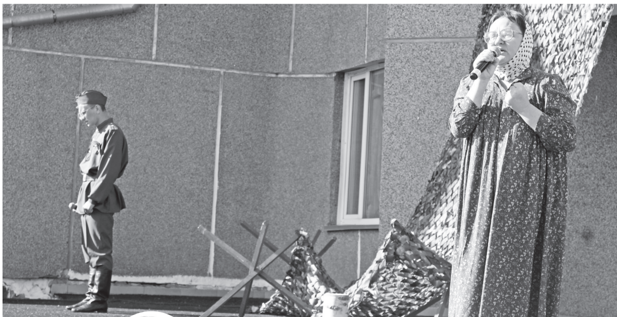
Провожала сына мать...