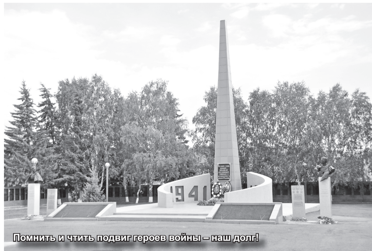
Помнить и чтить подвиг героев войны – наш долг!

С 2017 года по октябрь 2022 года Таштыпский район возглав-