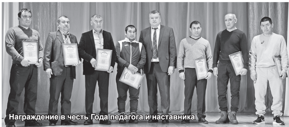
Награждение в честь Года педагога и наставника

День защитника Отечества нынче имел особое значение. И это весьма остро ощущалось в зале районного Дома культуры. Начнем с того, что сам концерт был благотворительным. Все собранные средства будут отправлены на помощь нашим бойцам – участникам СВО. Потому и стоимости билета никто не устанавливал. Каждый отдавал столько, сколько мог.