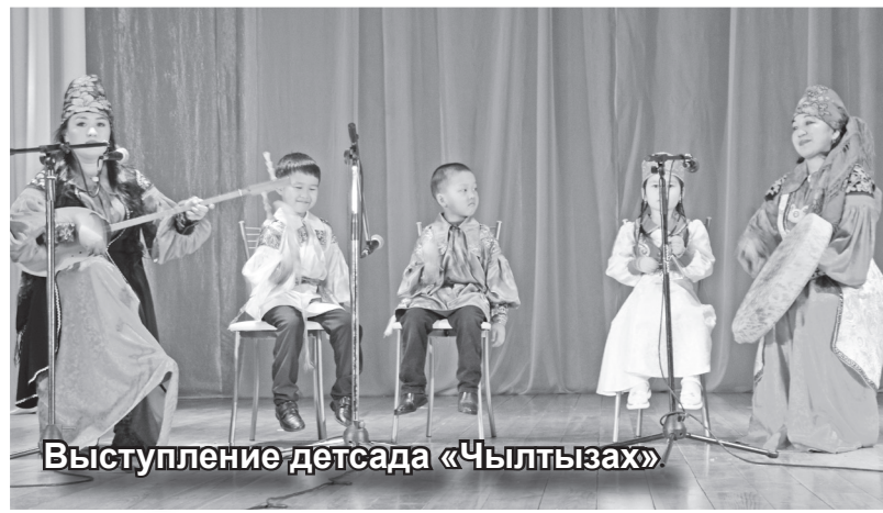
Выступление детсада «Чылтызах»