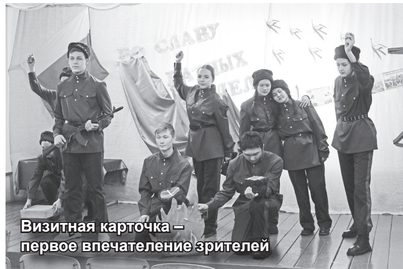
Визитная карточка – первое впечатление зрителей