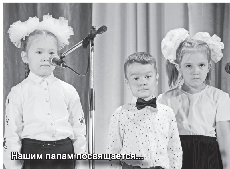
Нашим папам посвящается...