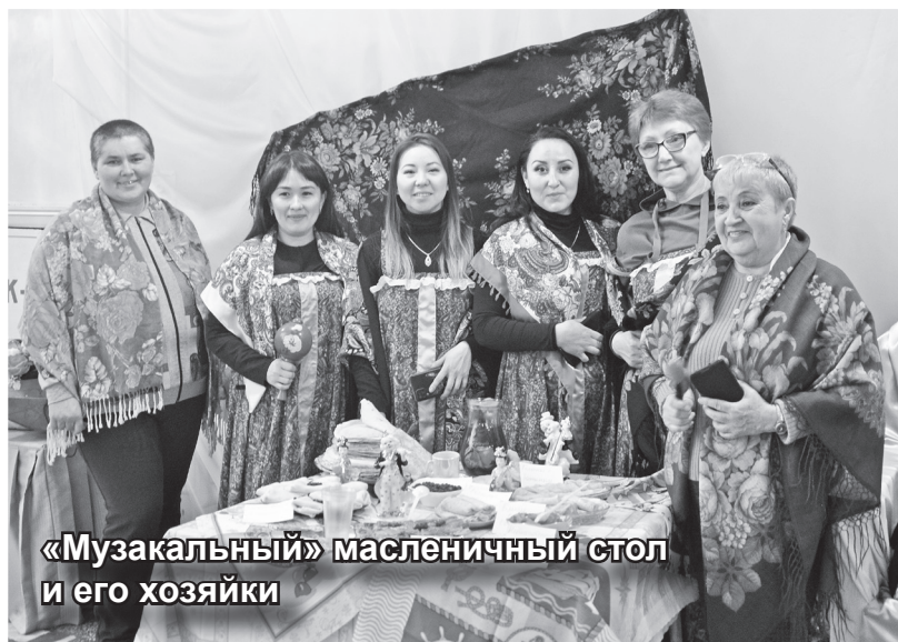
«Музыкальный» масленичный стол и его хозяйки

Широкую Масленицу беспощадная погода загнала в узкие стены РДК. О нет, наш Дом культуры так же просторен, как был, но для народного гуляния стены, как птице – клетка. Попробуй-ка вмести весь разудалый дух любимого праздника. Дух праздника, а с ним и накрытые столы, и Масленица в пестрых сарафанах, и веселые потехи, и песни, и частушки, и пляски, и конечно же, блинные баталии.