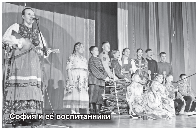
София и её воспитанники