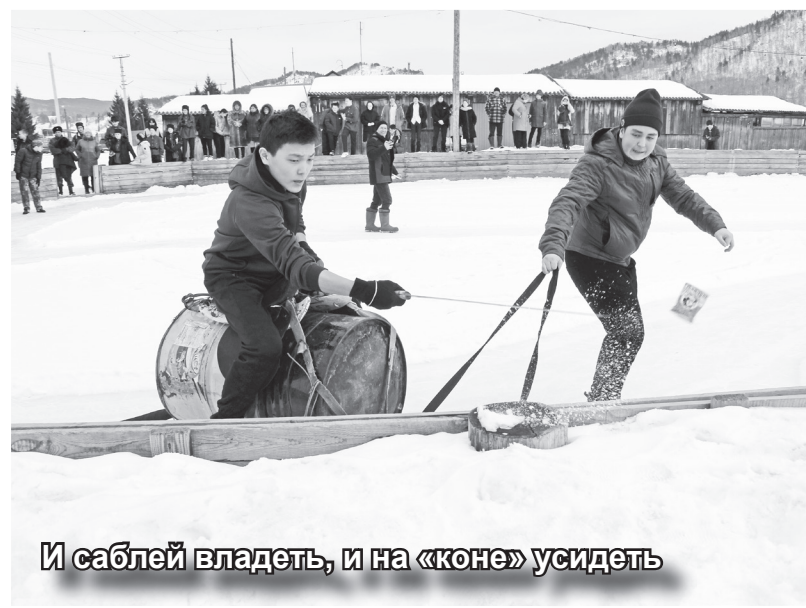
И саблей владеть, и на «коне» усидеть