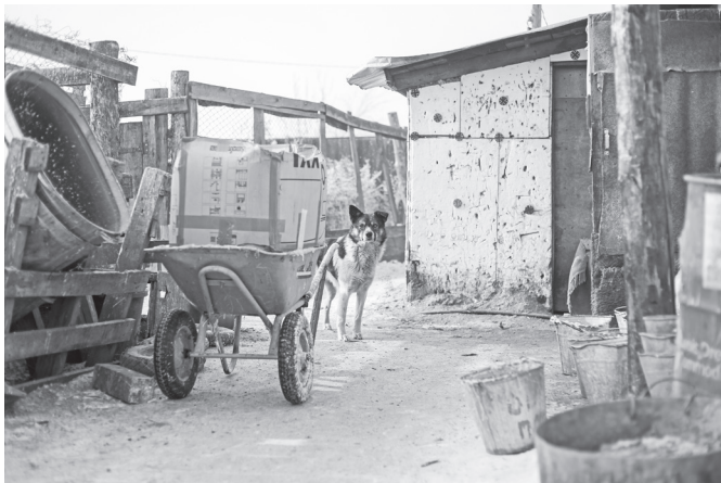
Жизнь, как она есть.

Мы в абаканском приюте «Каштанкин дом», где проживает около тысячи собак и кошек. Сегодня у нас с фотографом особая миссия – сделать, как можно больше снимков питомцев. Качественные фотографии привлекают внимание людей в социальных сетях. Кто знает, может на этот раз животных, которые обретут семью, станет больше?