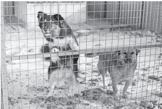
А это — Биба и Боба.

Его нашли на остановке пригородного автобуса после ДТП: пса сбила машина, он совсем не мог ходить. Нравнодушные люди доставили его в приют «Каштанкин дом». Здесь его вывели. Сейчас он контактный и ласковый, но совсем не любит выходить из своего маленького вольера, где чувствует себя защищенным. Выбегает на пару минут на улицу и тут же просится обратно.