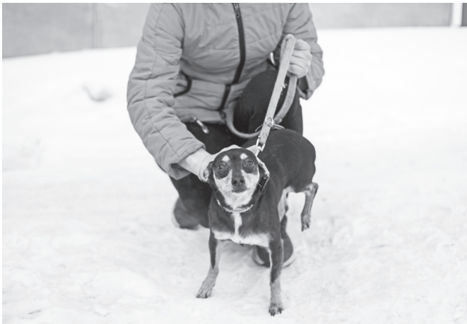
У этого пса очень ласковое и доброе имя — Андрюшка. Чего не скажешь про его судьбу...

Она подчеркивает, что не все животные были бездомными до того, как попали сюда. Многие из них преданно служили людям, имели крышу над головой, а потом оказались выброшенными, как надоевшая игрушка. Причины экс-хозяева называют разные: вдруг открылась аллергия, в семье появился младенец, сделали ремонт, а собака, оставшись одна, все грызет. Теперь этим несчастным ищут людей, которые их больше не бросят.