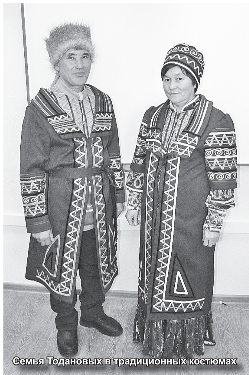
Семья Тодановых в традиционных костюмах

Сами подумайте, у этого человека был талант писать историю не простыми очерками и записками, а литературно. Он перевел на шорский язык Библию, вел службы на шорском языке, обучал детей. Он писал историю, он любил своих шорцев, он любил свой народ.