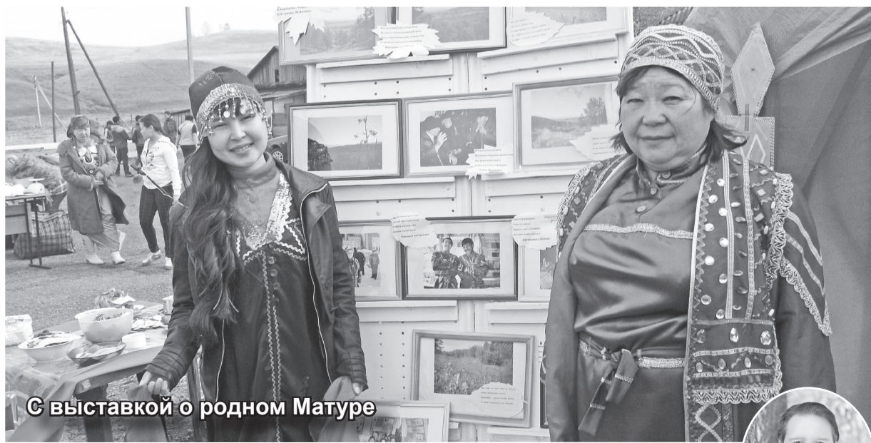
С выставкой о родном Матуре

Вот так, сообщая, люди, независимо от национальности, поддерживают и сохраняют свою историю. Люди, поистине любящие свою малую родину, как когда-то её любил их великий предок Иван Штыгашев.