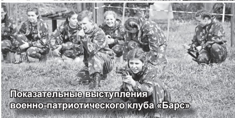
Показательные выступления военно-патриотического клуба «Барс»