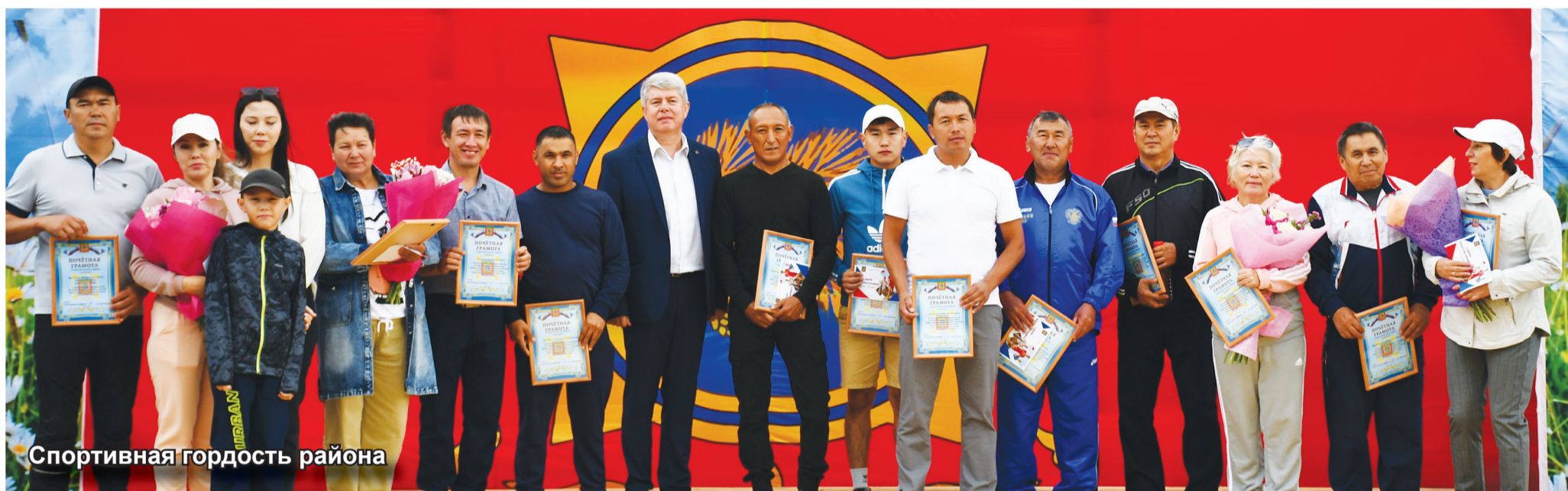
Спортивная гордость района