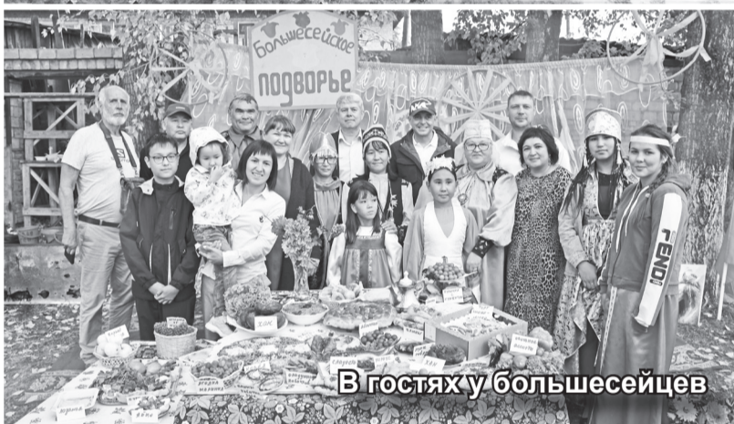
В гостях у большесейцев