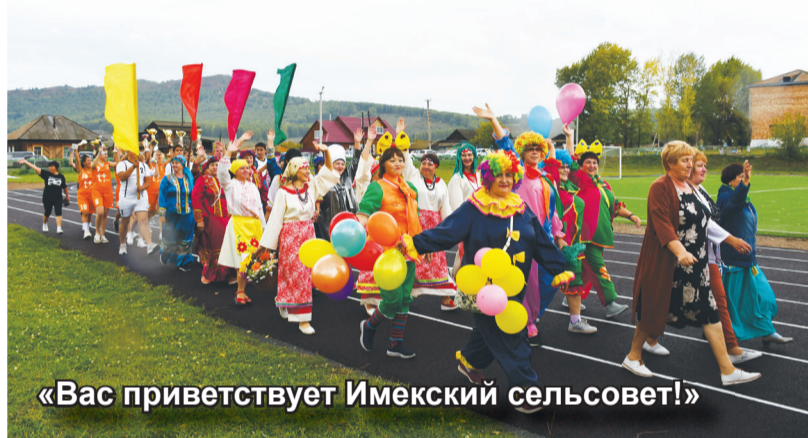
«Вас приветствует Имекский сельсовет!»