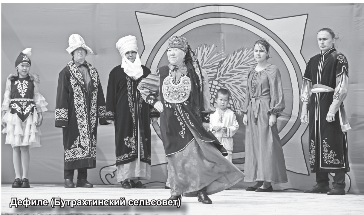
Дефиле (Бутрахтинский сельсовет)