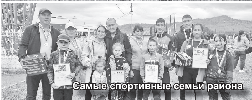
Самые спортивные семьи района