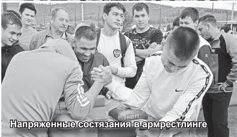
Напряженные состязания в армрестлинге

ны, созданные руками местных мастеров. Некоторые сельсоветы отмечали достижения своих спортсменов, создав стенды с их кубками и грамотами.