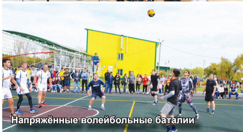
Напряжённые волейбольные баталии

Есть праздники, которые особенно любят и ждут все. Которые дороги сердцу, потому что затрагивают самые добрые и хорошие качества людей, такие как умение дружить. Именно поэтому жителям нашего района так близок и дорог праздник «Ынархас – Дружба», ведь жители нашего многонационального района умеют дружить.