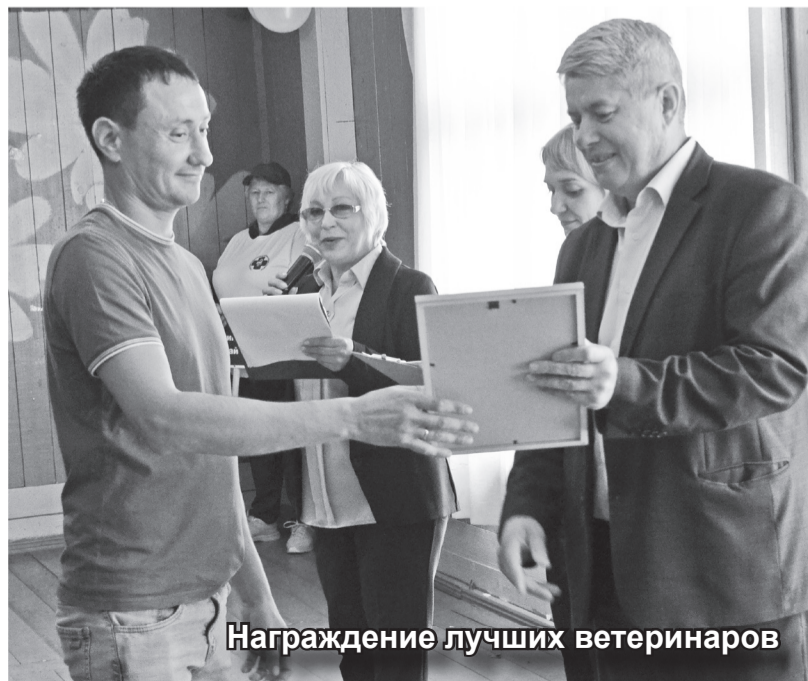
Награждение лучших ветеринаров