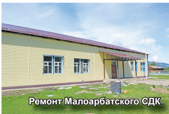
Ремонт Малоарбатского СДК