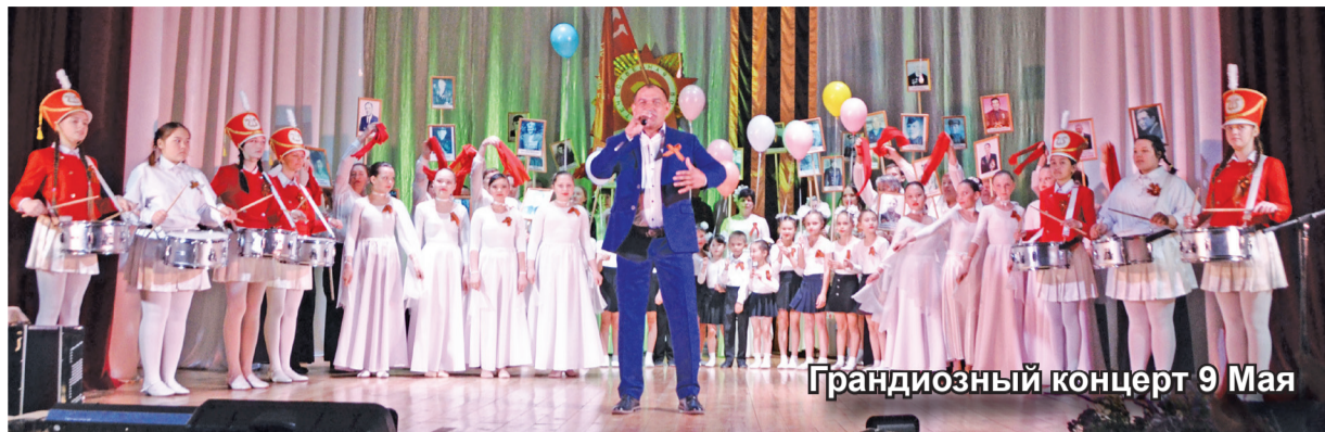
Грандиозный концерт 9 Мая