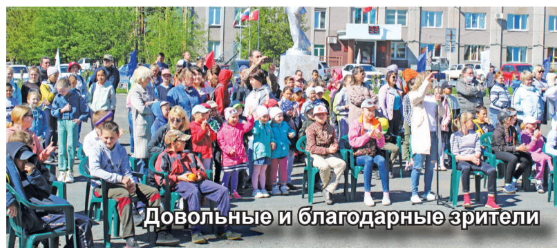
Довольные и благодарные зрители