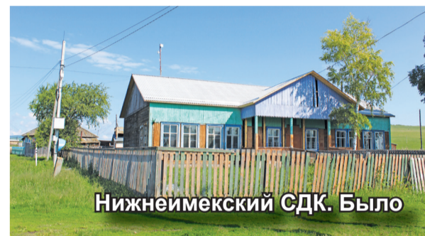
Нижнеимекский СДК. Было