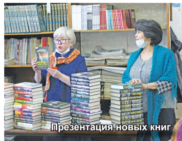
Презентация новых книг

лауреатом II степени, ансамбль – III степени. Праздничные концерты, мероприятия, спектакли, митинги, акции, познавательные квесты – это и многое другое всегда с большим нетерпением ждут жители района.