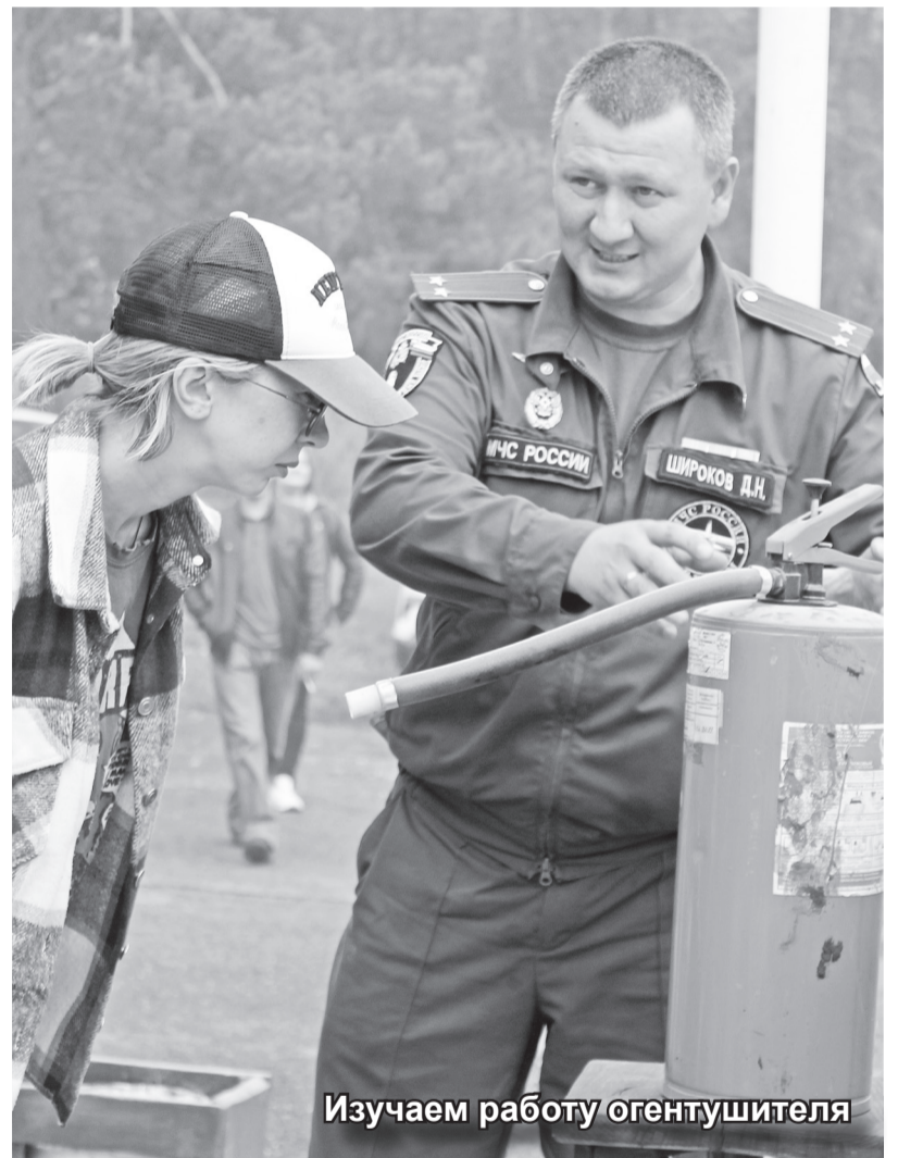
Изучаем работу огнетушителя