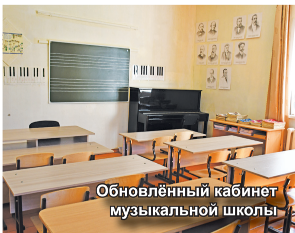
Обновлённый кабинет музыкальной школы