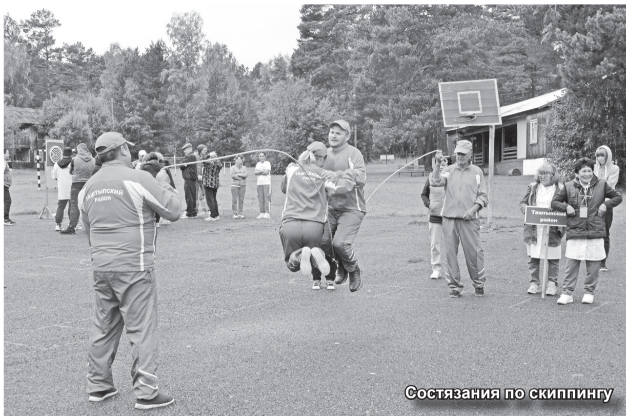
Состязания по скиппингу

19 августа на базе детского оздоровительного лагеря «Се-ребряный ключ» прошел заключительный этап республиканского конкурса профессионального мастерства «Ветеринария наше призвание». В состязаниях приняли участие 12 команд: коллективы Хакасской ветлаборатории, Абаканской, Аскизской, Алтайской, Боградской, Орджоникидзевской, Саяногорской, Таштыпской, Усть-Абаканской, Черногорской и Ширинской ветстанций.