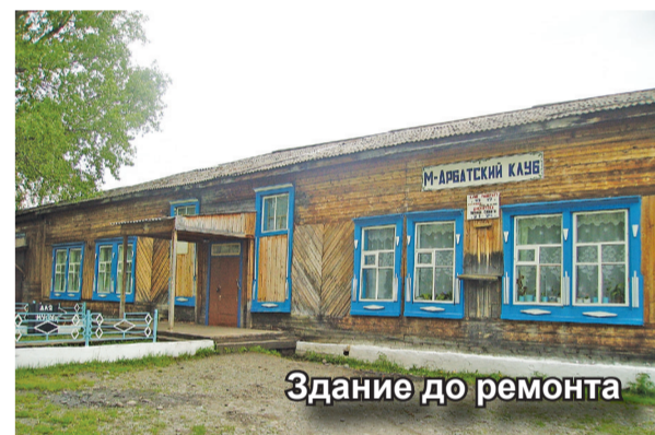
Здание до ремонта