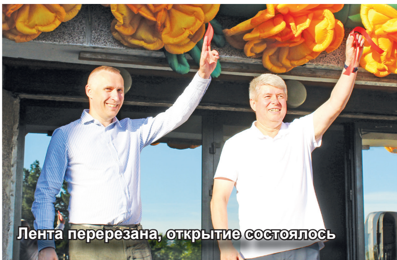
Лента перерезана, открытие состоялось

Радио дарит хорошее настроение дома, в дороге и в день презентации! В минувшую пятницу на площади возле РДК прошла презентация радио в Таштыпском районе.