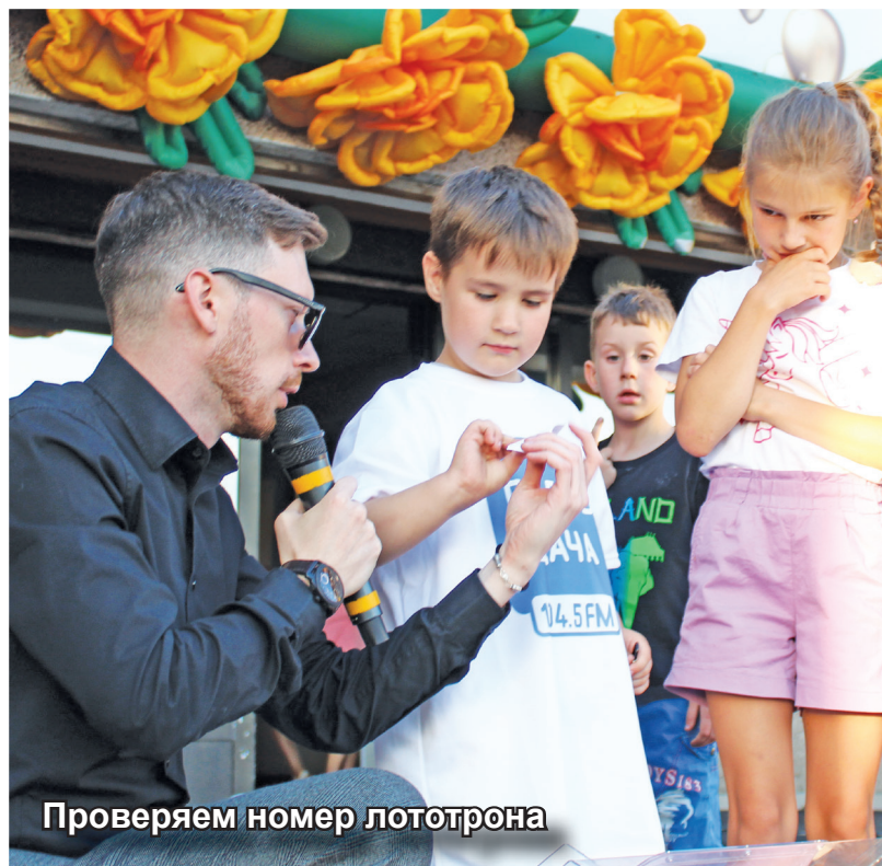
Проверяем номер лототрона