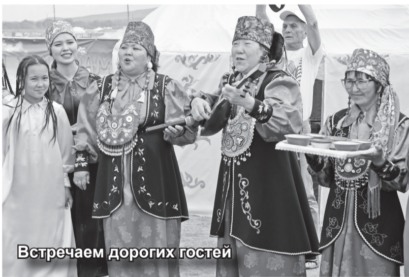
Встречаем дорогих гостей