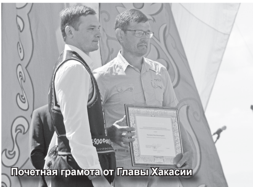
Почетная грамота от Главы Хакасии