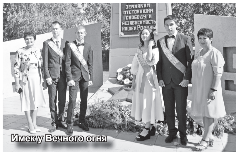
Имейку Вечного огня

В общем, путевку в жизнь получили 28 выпускников – специалисты сельского хозяйства, лесной отрасли, строители и повара. Судьба ребят, конечно, сложится по-разному, но одно точно – именно ПУ-16 стало для них надежным стартом в профессию. А остальное уже зависит от них самих.