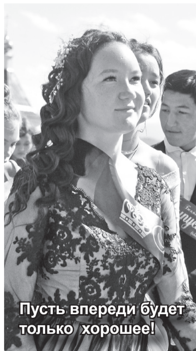
Пусть впереди будет только хорошее!