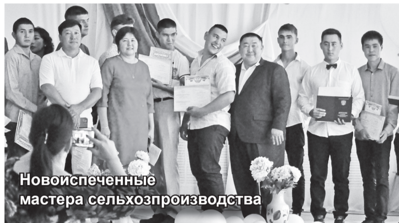
Новоиспеченные мастера сельхозпроизводства

А днем ранее своих выпускников проводило в большую жизнь профессиональное училище №16.