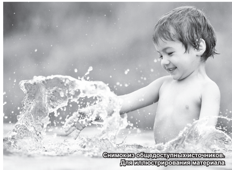
Снимок из общедоступных источников. Для иллюстрирования материала

С наступлением солнечной, и что не менее важно, жаркой погоды население нашего района потянулось к берегам водоемов. Ведь всем известно, для того чтобы привести организм в норму и снизить вредное тепловое воздействие на него светила, нужно всего лишь нырнуть в прохладную и ласковую воду. Но, оказывается, для того чтобы водные процедуры на лоне природы прошли без негативных последствий для организма, нужно соблюдать правила.