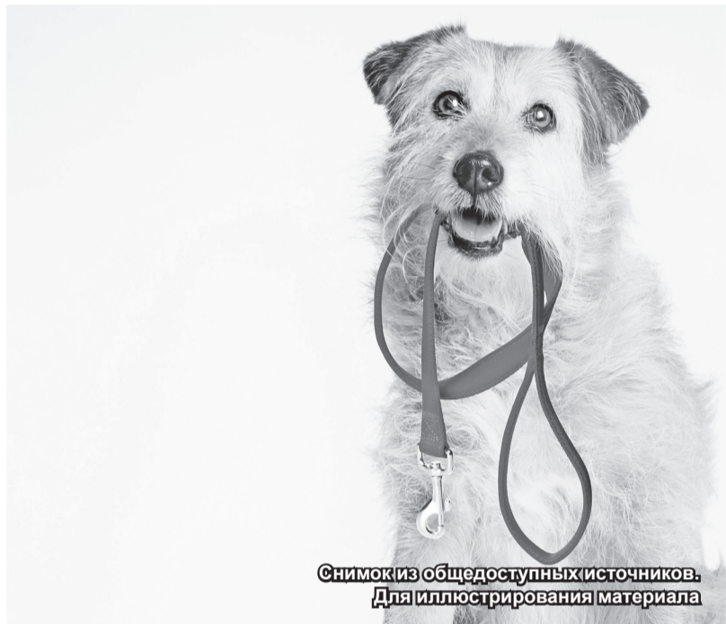
Снимок из общедоступных источников. Для иллюстрирования материала

Департамент ветеринарии Министерства сельского хозяйства и продовольствия Республики Хакасия разъясняет владельцам животных обязательные требования законодательства в области обращения с животными при содержании домашних животных.