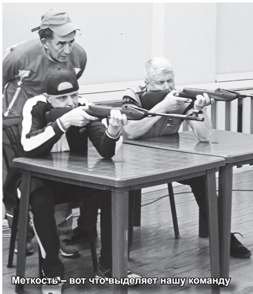
Меткость – вот что выделяет нашу команду

Победителей и призёров наградили кубками, дипломами и медалями. Теперь им предстоит подготовка к следующей, уже зимней, спартакиаде муниципалитетов, и мы надеемся, что команда Таштыпского района покажет тот же результат, что и на летних играх.