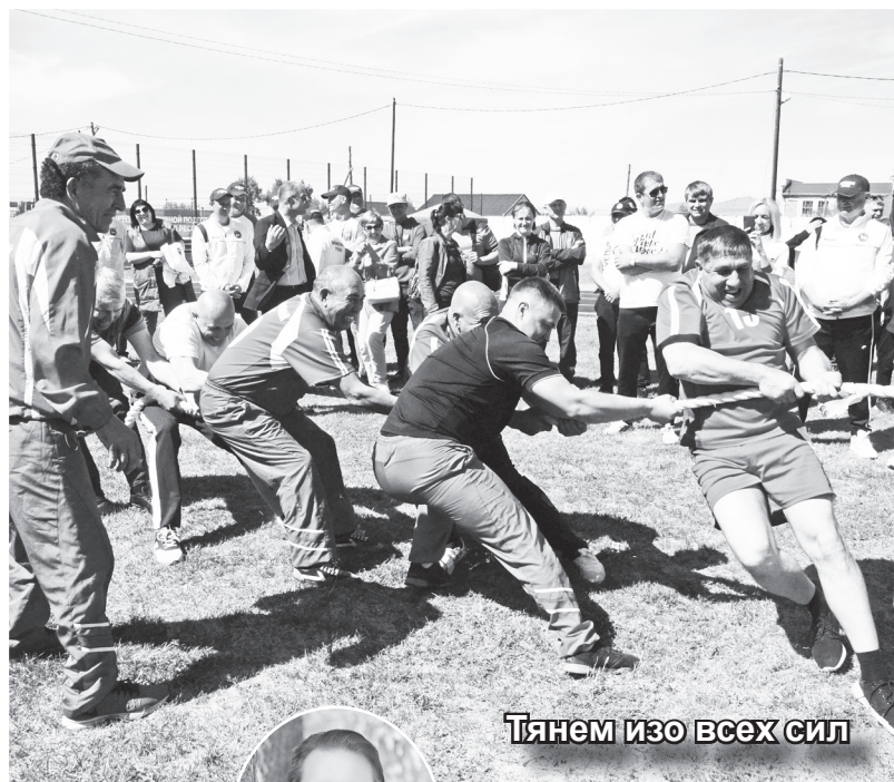
Тянем изо всех сил