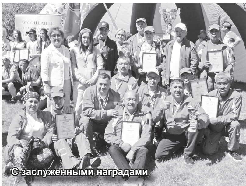
С заслуженными наградами

9 и 10 июня в Ширинском районе состоялась седьмая спартакиада Совета муниципальных образований Республики Хакасия. Участие приняли: Таштыпский, Ширинский, Усть-Абаканский, Богградский, Аскизский, Бейский и Орджоникидзевский районы, города – Абакан и Сорск.