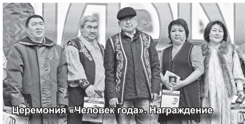
Церемония «Человек года». Награждение

Также Таштыпский район стал дипломантом «За оригинальность игровой программы», организованной при поддержке Таштыпского Центра детского творчества.