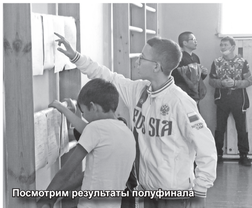
Посмотрим результаты полуфинала