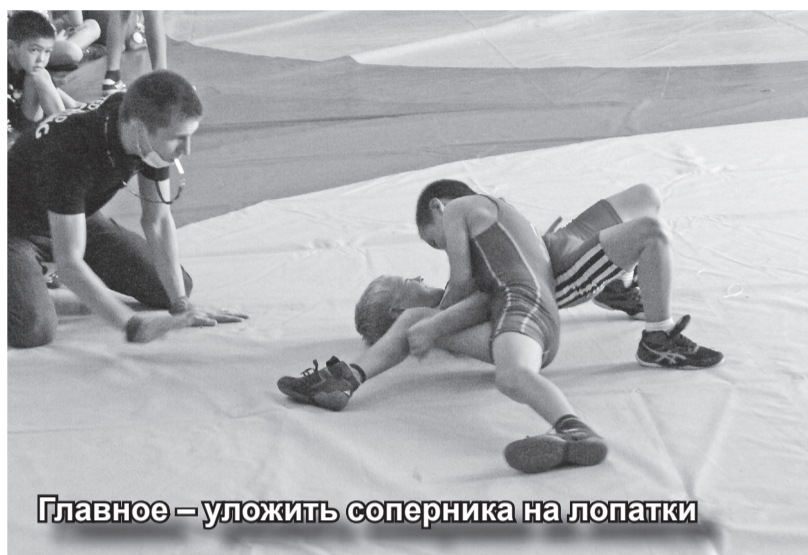
Главное – уложить соперника на лопатки

9 октября на базе Матурской школы прошли районные соревнования по вольной борьбе, посвящённые 160-летию хакасского писателя, миссионера И.М. Штыгашева.