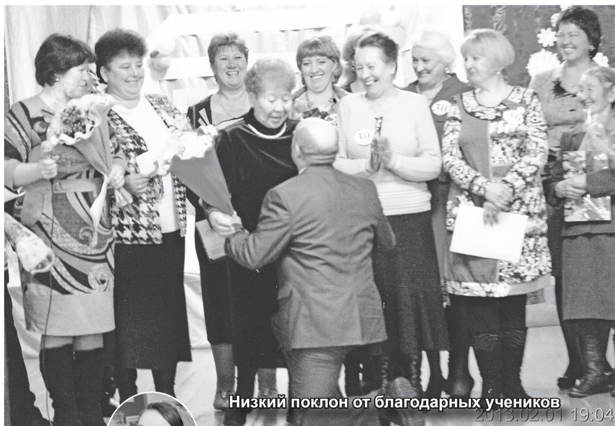
Низкий поклон от благодарных учеников