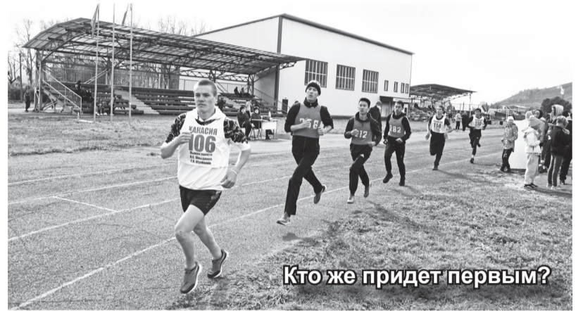
Кто же придет первым?