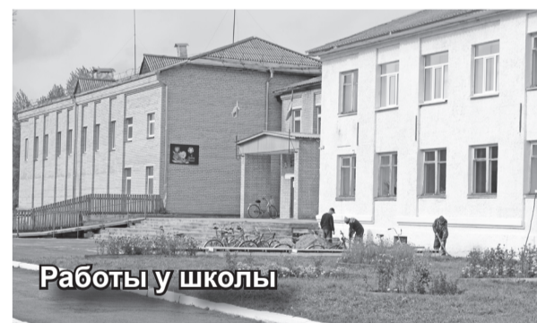
Работы у школы

Теплее станет и в Малоарбатской школе. Там будут утеплены стены, установлены новые пластиковые окна. На сегодняшний день в актовом зале установлен второй ряд батарей. По периметру здания делают новую отмостку. Старая пришла в негодность и во время дождей фундамент подмывался. Новая отмостка и водостоки позволят сохранить здание в хорошем состоянии.