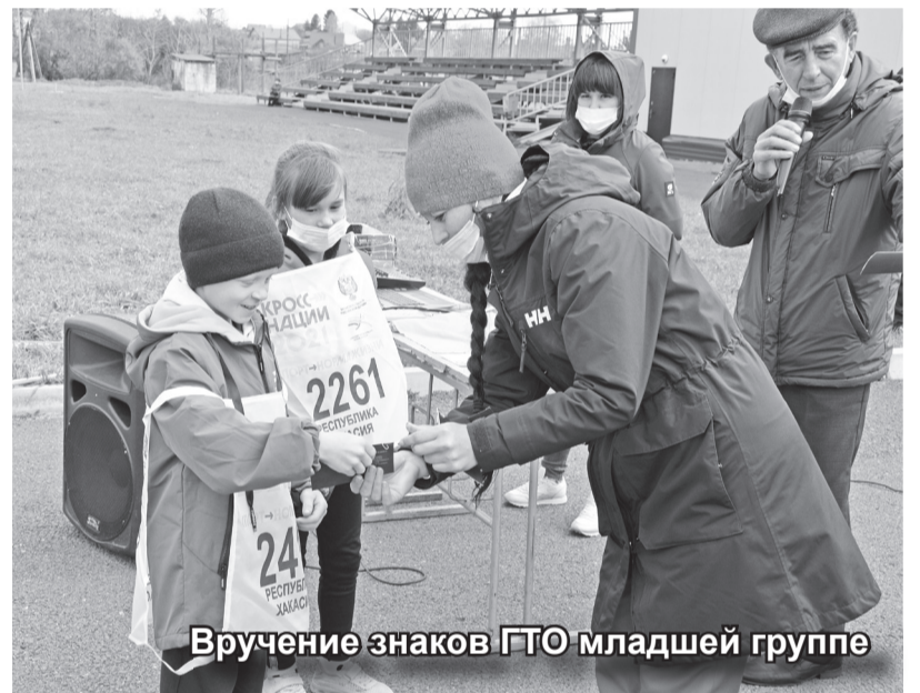
Вручение знаков ГТО младшей группе