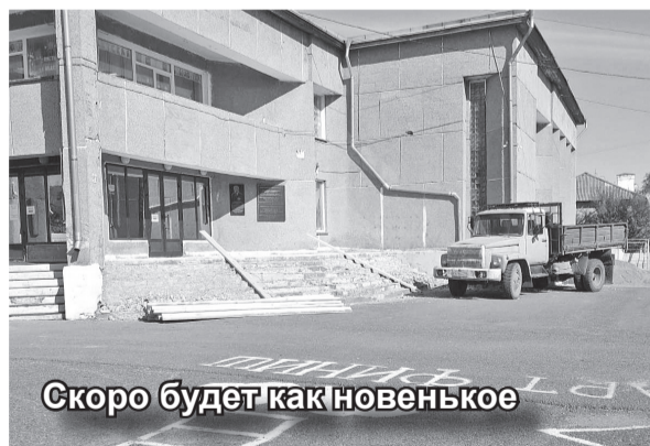
Скоро будет как новенькое

Крыльцо и пандус районного Дома культуры и районной библиотеки скоро станут удобнее и красивее – там начались ремонтные работы, выполняет которые фирма «ДЕКА» ИП Д.Е. Круговых.