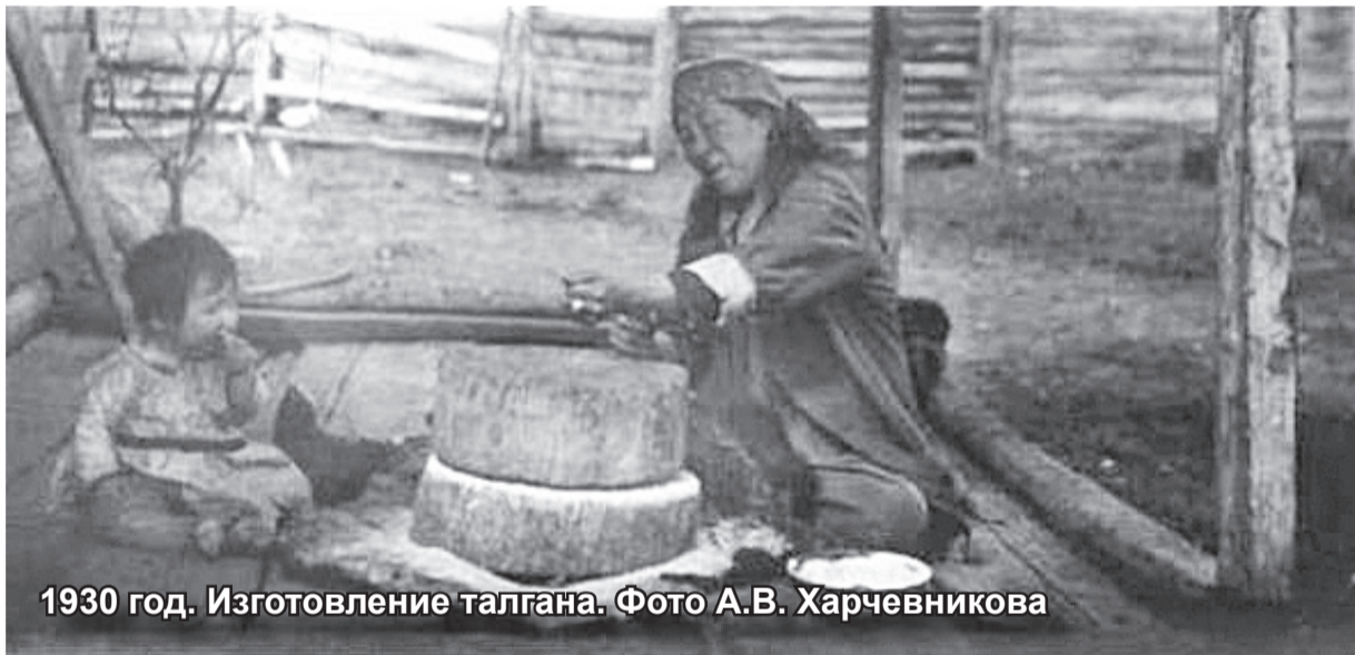
1930 год. Изготовление талгана.

Как пишет В.Я. Бутонев в книге «Социально-экономическая история хакасского аала», на территории хакасских ведомств водяные мельницы были построены русскими крестьянами. Если на ручной мельнице можно было намолоть от силы 1 мешок зерна, работая от зари до зари, то на водяной мельнице намолочивали до 30 мешков зерна. Поэтому у мельниц образовывались большие очереди повозок с нагруженными мешками зерна.