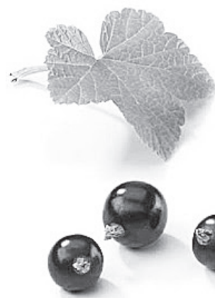
Желе с мягкими ягодками

Правильно приготовленное и укуренное варенье способно храниться при комнатной температуре в течение 2-3 лет. Продукт имеет довольно густую консистенцию. Его можно использовать в качестве начинки для домашних пирогов.