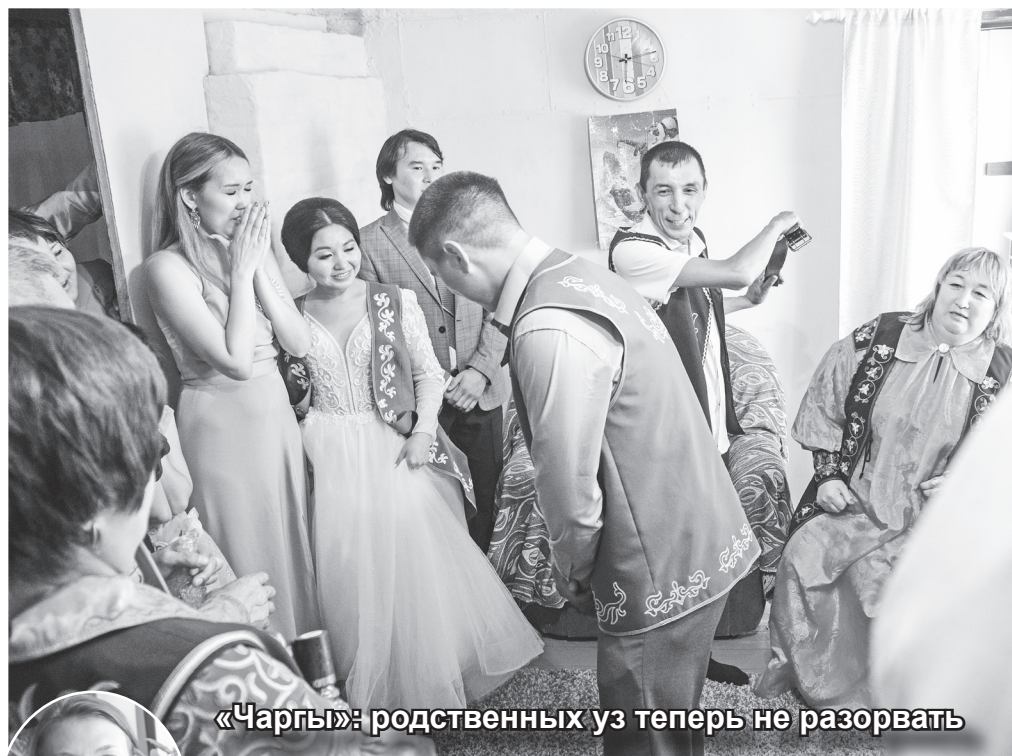
«Чаргы»: родственников уз теперь не разорвать