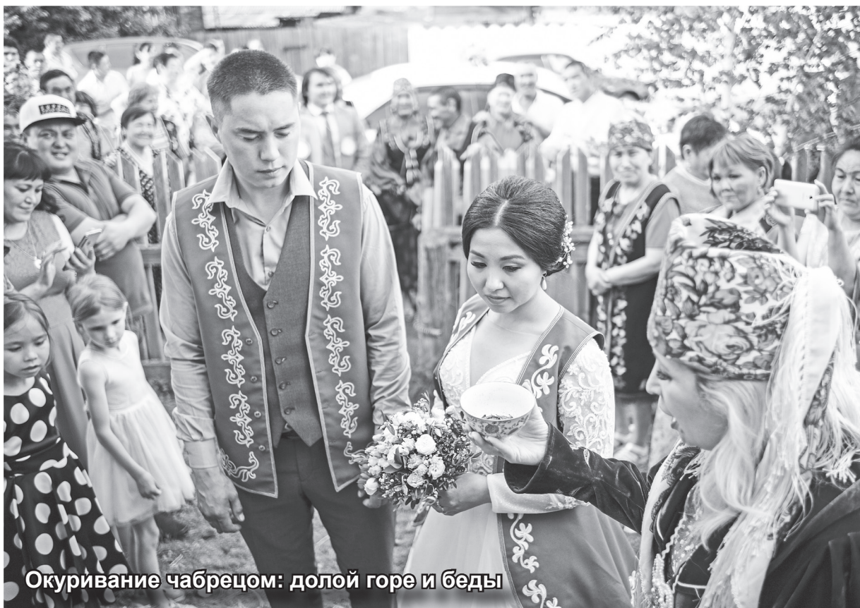
Окуривание чабрецом: долой горе и беды

Однако традиционного стеганья молодой жены березовым прутиком, которое должна была провести «ниге» – старшая невестка или сестра со стороны невесты,