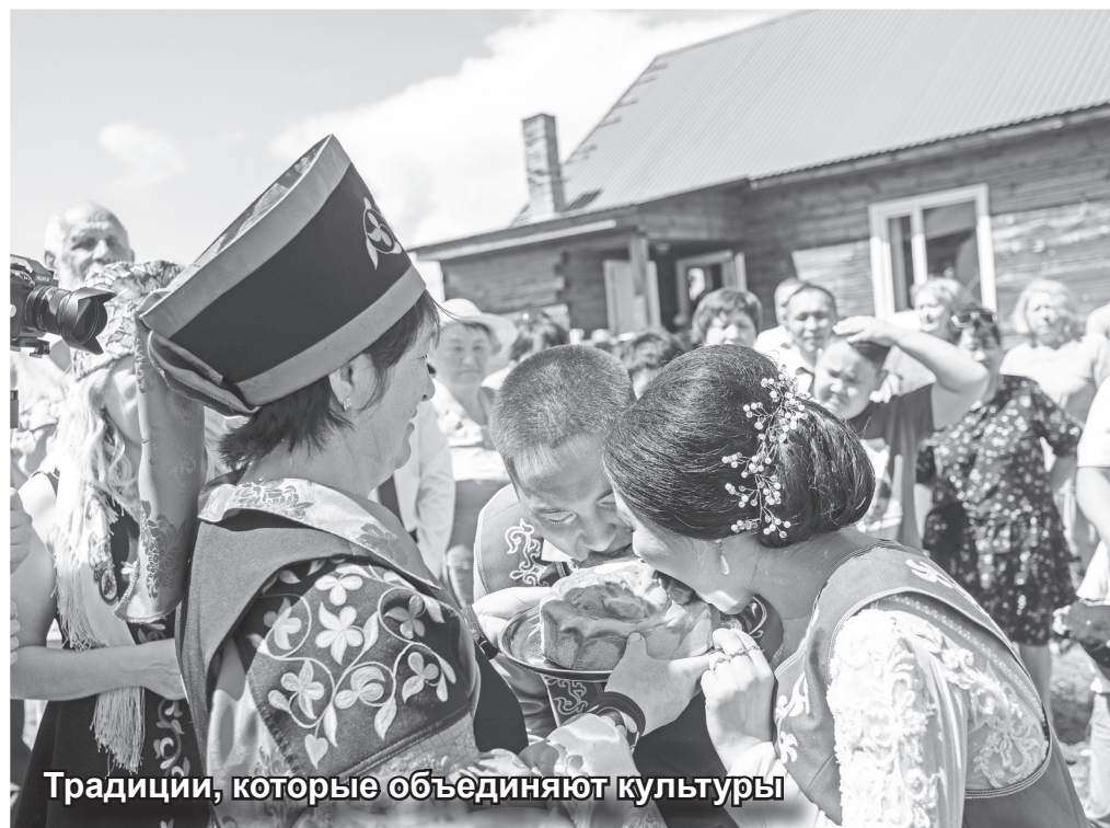
Традиции, которые объединяют культуры

Познакомившись ближе с молодыми людьми, хочу пожелать им только крепкого здоровья всей их большой семье, поскольку верится, что у них все-все получится, чего бы они ни пожелали!