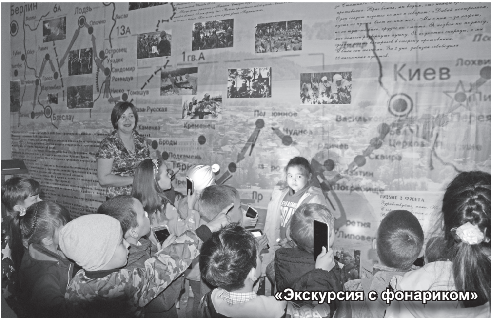
«Экскурсия с фонариком»

В минувшую пятницу Таштыпский краеведческий музей присоединился к международной акции «Ночь в музее». Это событие приурочено к Международному дню музеев, который отмечается ежегодно 18 мая. Многие мировые музеи в эти дни открывают свои двери для посетителей от захода солнца и до утра.