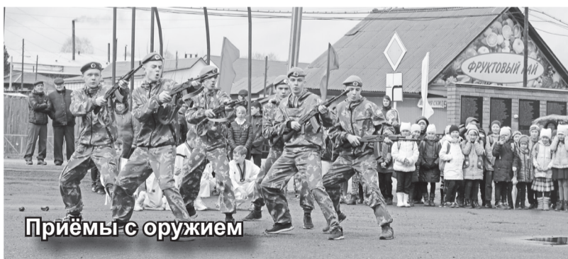
Приёмы с оружием

блики. Далее – минута молчания и возложение венков к мемориалу павшим в годы войны 1941-1945 гг. землякам.