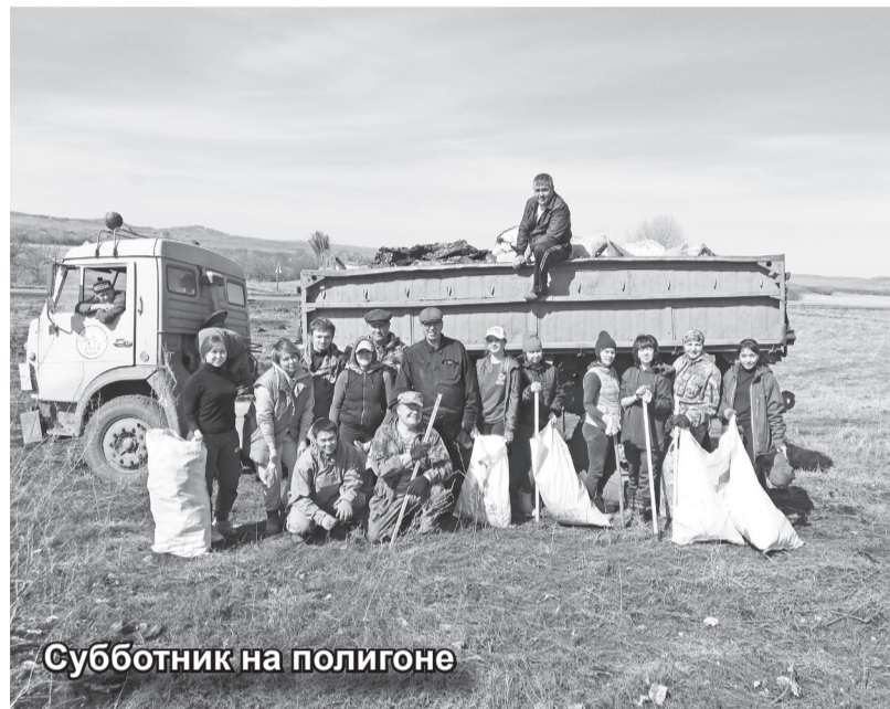
Субботник на полигоне