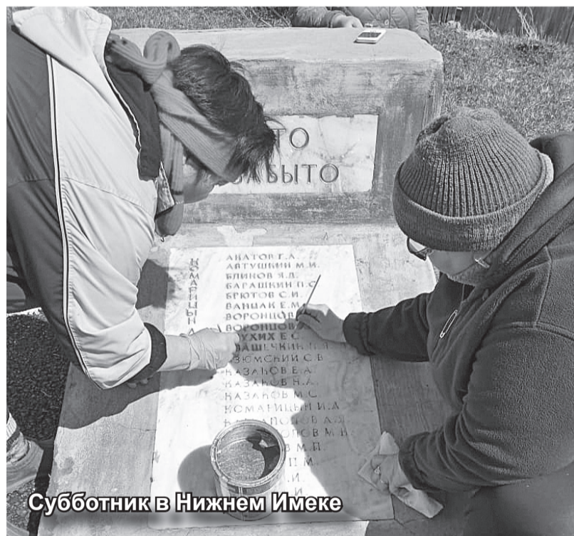
Субботник в Нижнем Именке