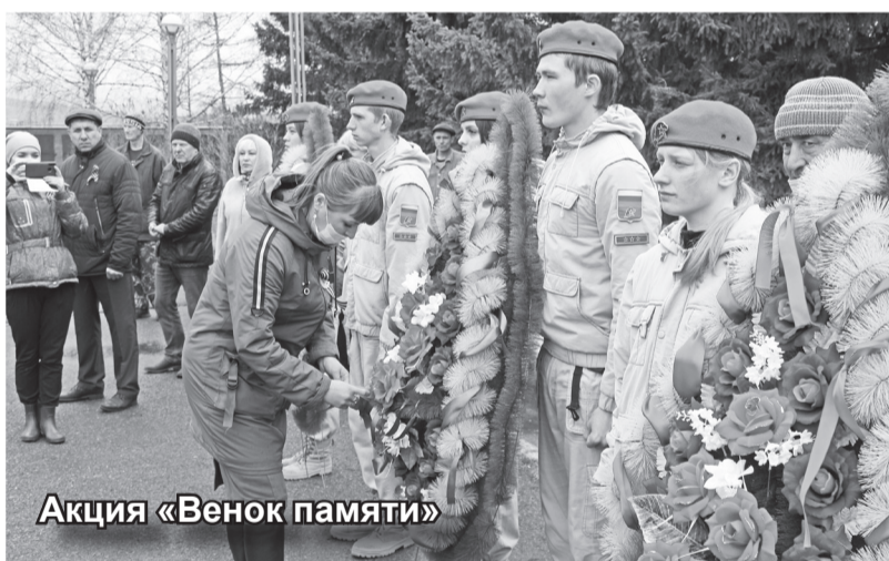
Акция «Венок памяти»