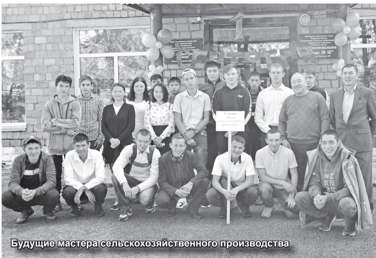
Будущие мастера сельскохозяйственного производства