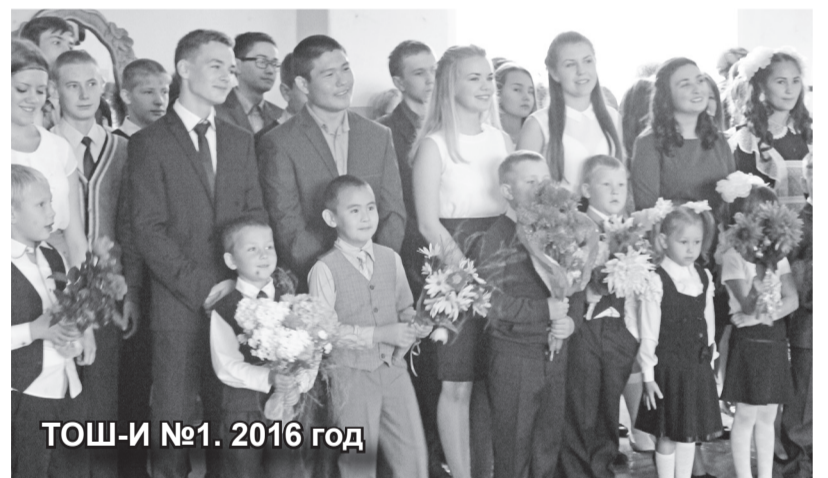
ТОШ-И №1. 2016 год