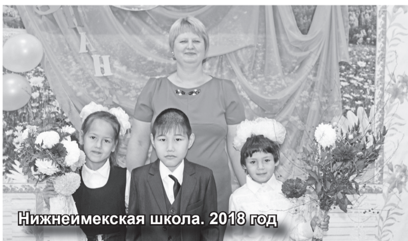
Нижнеимекская школа. 2018 год