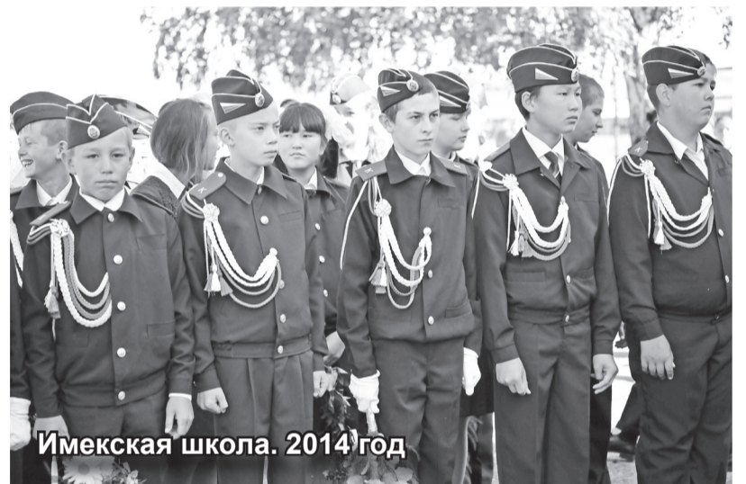
Имекская школа. 2014 год