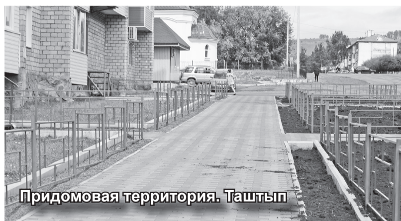
Придомовая территория. Таштып

Более подробно о том, как работают национальные проекты в Таштыпском районе мы расскажем в следующих номерах нашей газеты, ведь в реализации национальных проектов на муниципальном уровне принимают участие почти все управления и отделы районной администрации, а также сельсоветов. Мы постараемся рассказать о работе каждого из них.