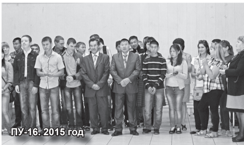
ПУ-16. 2015 год