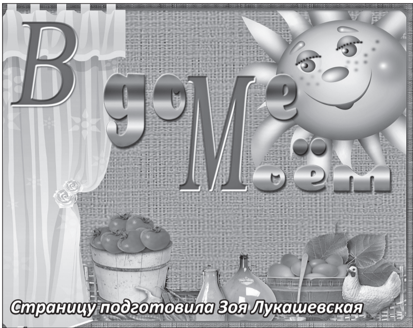
Страницу подготовила Зоя Лукашевская

Мне очень нравятся быстрые, простые, проверенные рецепты – они всегда получаются вкусными и уходят на ура. Но иногда что-то целкает в голову и думаешь «А приготовлю-ка я что-то оригинальное». В результате некоторые блюда бракуются, а некоторые приживаются и вносят разнообразие в домашнее меню.