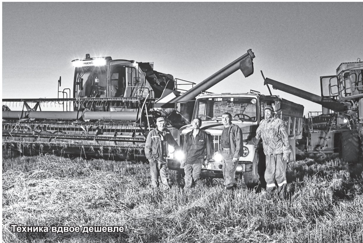
Техника вдвое дешевле