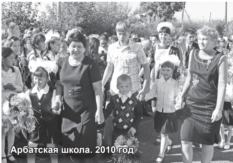
Арбатская школа. 2010 год