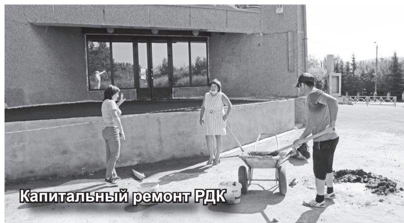
Капитальный ремонт РДК