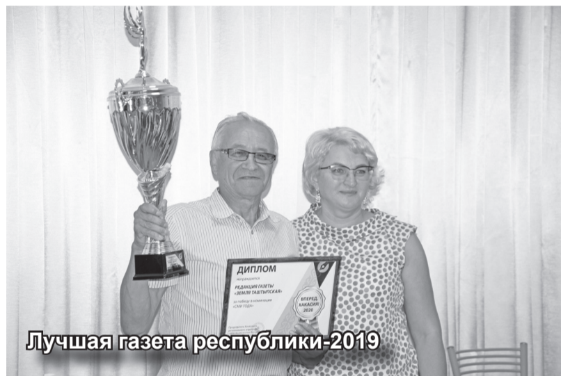
Лучшая газета республики-2019