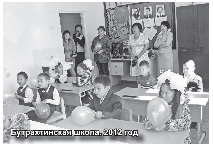
Бутрахтинская школа. 2012 год