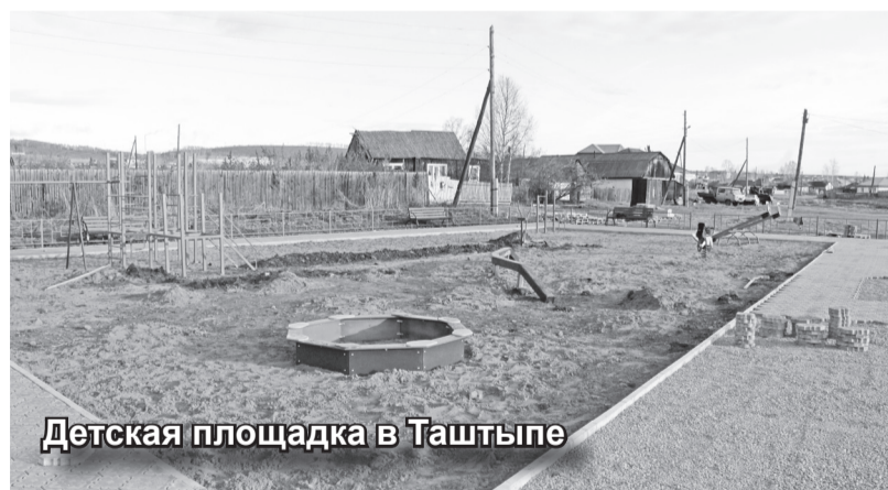
Детская площадка в Таштыпе