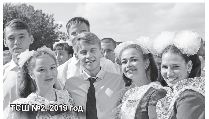
ТСШ №2. 2019 год

Целью школы всегда должно быть воспитание гармоничной личности, а не специалиста.