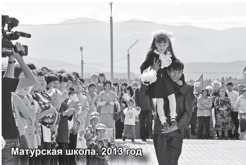
Матурская школа. 2013 год