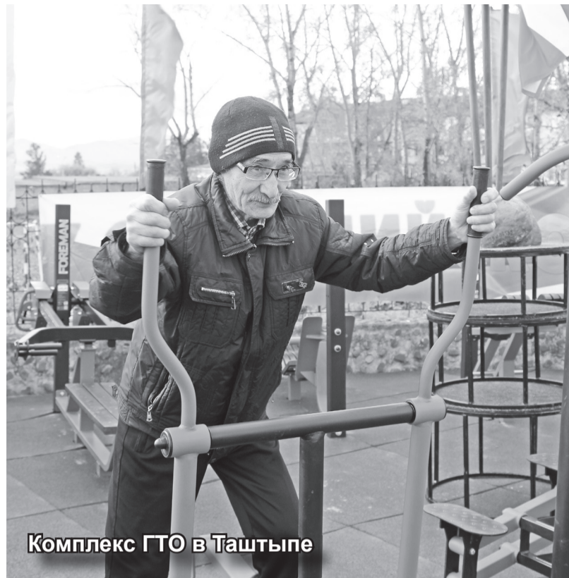
Комплекс ГТО в Таштыпе