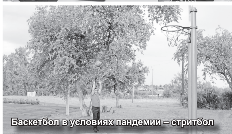
Баскетбол в условиях пандемии – стритбол