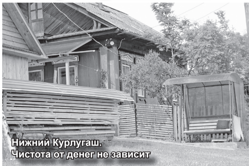
Нижний Курлугаш. Чистота от денег не зависит