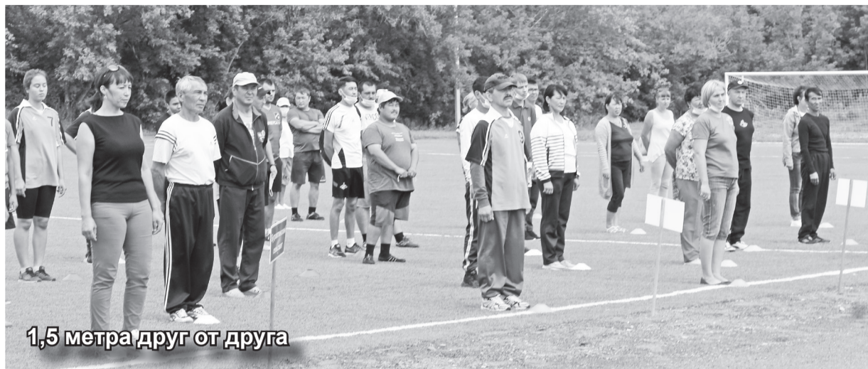
1,5 метра друг от друга