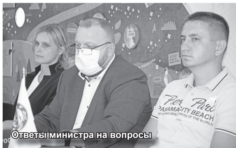
Ответы министра на вопросы

Из всей этой рабочей поездки можно сделать вывод. У нас есть, что посмотреть и прекрасно отдохнуть в родной Хакасии есть горы, степь, озера необходимо желание сделать все это доступно и с комфортом не только для жителей Хакасии, но и всей нашей России.