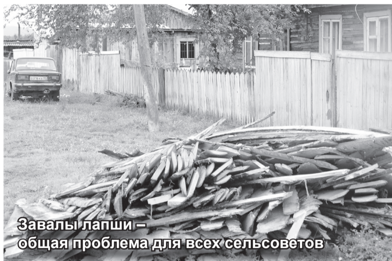
Завалы лапши – общая проблема для всех сельсоветов