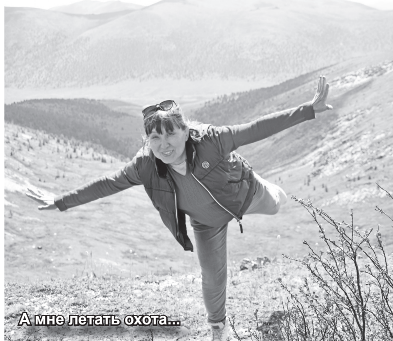
А мне летать охота...