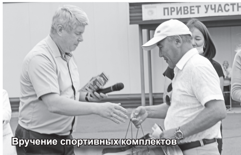
Вручение спортивных комплектов