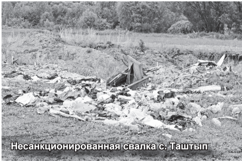
Несанкционированная свалка с. Таштып