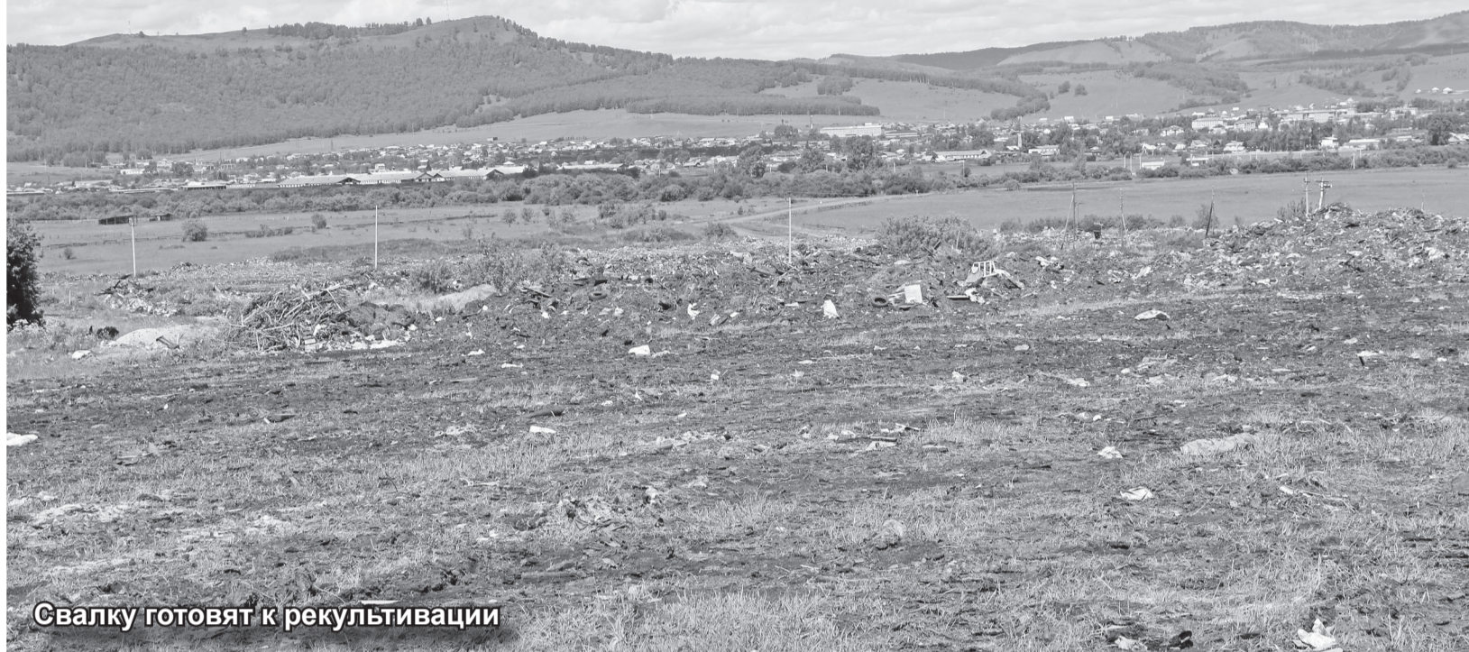
Свалку готовят к рекультивации

В прошлом месяце прогрессивная часть населения нашей страны отметила День эколога. У любознательного читателя возникает вопрос: «Чем так важна экология и борьба с загрязнением окружающей среды, что для привлечения внимания к этой, безусловно, проблеме, даже день в календаре выделили?» Ответ очевиден: «Потому что!» А если серьезно, то ответ действительно очевиден!