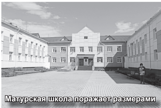
Матурская школа поражает размерами

В Матуре первым делом осмотрели здание школы. Оно просто поражает своими размерами – никак не ожидаешь увидеть такую большую школу в отдаленном селе. Конечно, содержание обходится довольно затратно. Несмотря на то что школа была построена сравнительно недавно, в 2013 году, определенные проблемы уже появились.