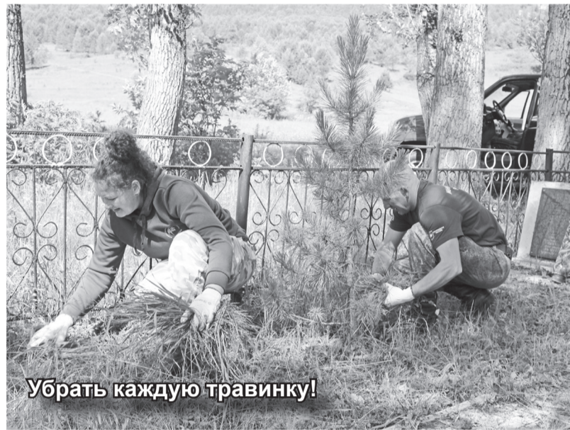
Убрать каждую травинку!