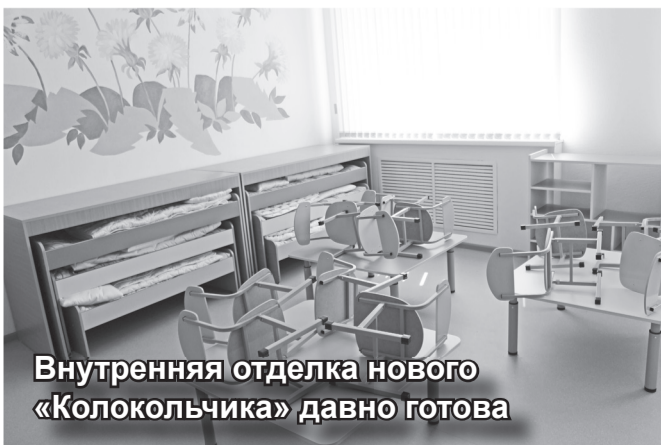
Внутренняя отделка нового «Колокольчика» давно готова

А вот в строительство нового детского сада уже вложено немало средств. Сейчас рабочие подрядчика «Хакасивол-Строй» прокладывают коммуникации, обустраивают котельную и склад угля. Но дождливое лето не дает про-