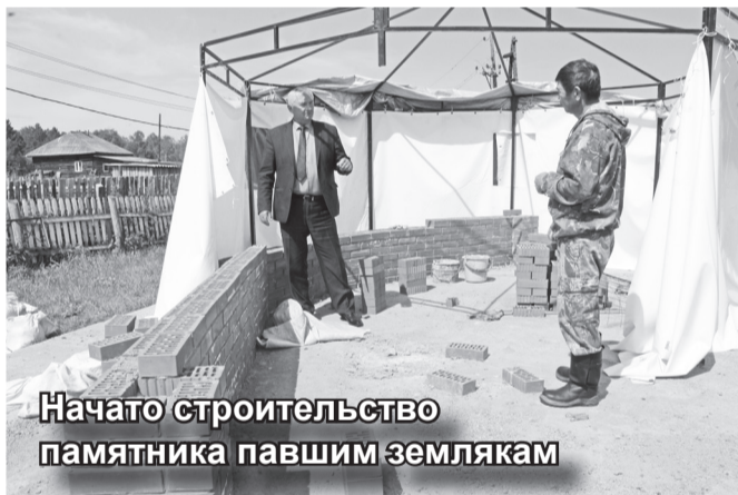
Начато строительство памятника павшим землякам