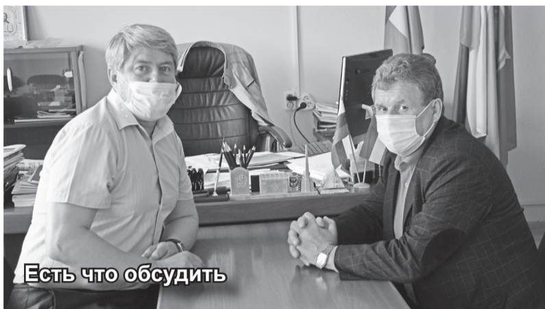
Есть что обсудить