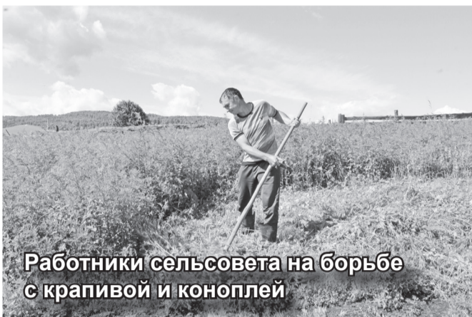
Работники сельсовета на борьбе с крапивой и коноплей