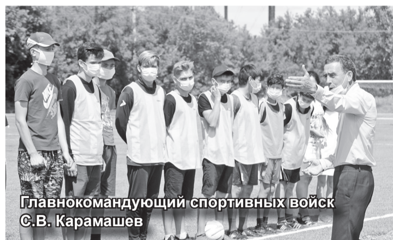
Главнокомандующий спортивных войск С.В. Карамшев