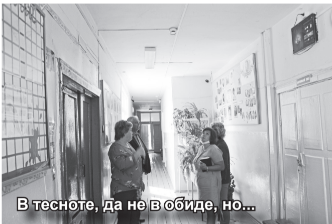
В тесноте, да не в обиде, но...

– Нам нужно новое здание. Ведь то, в котором мы сейчас занимаемся, было построено под детский сад в 1997 году. Для маленьких ребятишек оно бы подошло, но у нас же и старшеклассники есть.