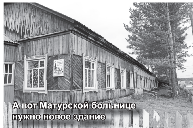
А вот Матурской больнице нужно новое здание

Стоит отметить, что жители села очень дорожат своей больницей и уже несколько лет отстаивают свое право на доступную медицину.