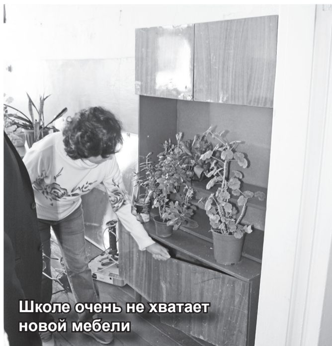
Школе очень не хватает новой мебели

Не хватает отдаленной школе и новой мебели.