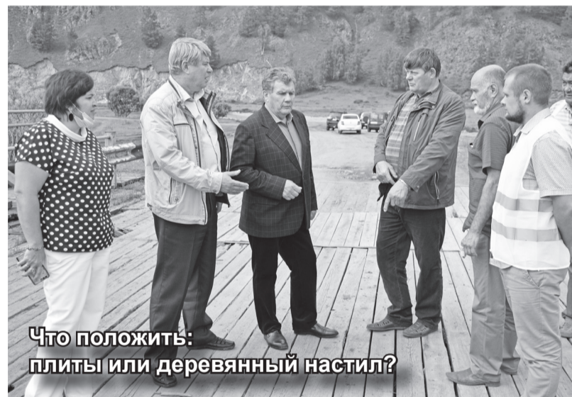
Что положить: плиты или деревянный настил?