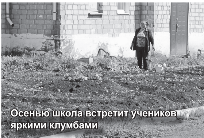
Осенью школа встретит учеников яркими клумбами