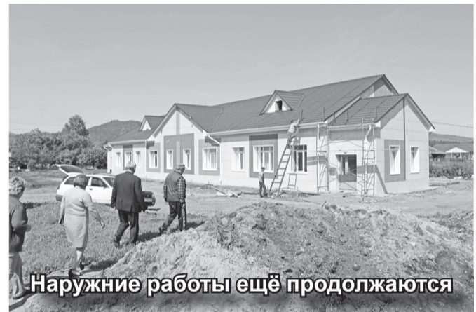
Наружние работы ещё продолжаются