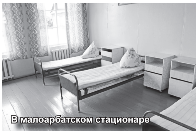
В малоарбатском стационаре