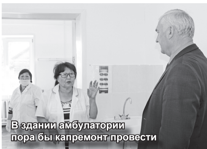
В здании амбулатории пора бы капремонт провести

Сейчас в школе подготавливают три кабинета «Точка роста» и два – «Цифровая образовательная среда».