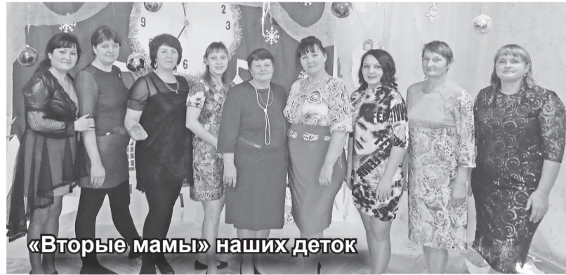
«Вторые мамы» наших деток

Вот и настало время попрощаться с нашим любимым детским садом «Колокольчик».