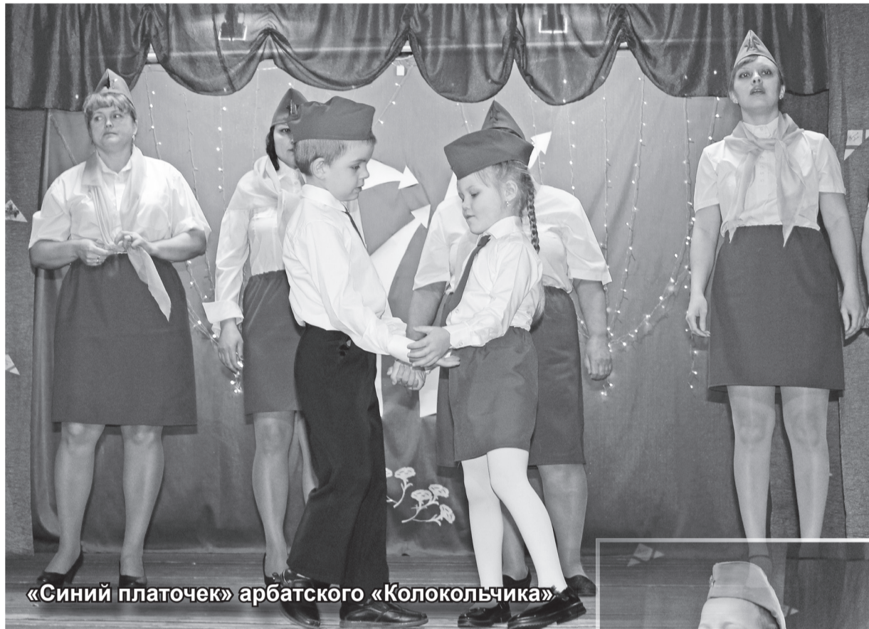
«Синий платочек» арбатского «Колокольчика»

В качестве члена жюри я присутствовала на конкурсе патриотической песни «Мы этой памяти верны», который проводился в Арбатах.