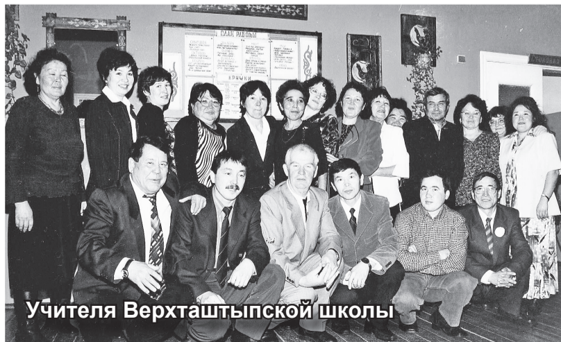
Учителя Верхташтыпской школы

Потенциалом развития территории во все времена были люди, а своими людьми край потомственных охотников и рыбаков славился всегда.