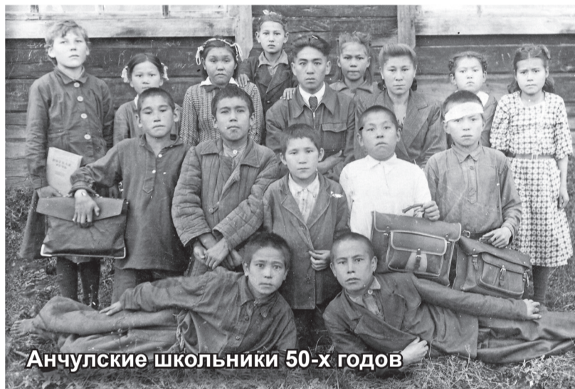
Анчулские школьники 50-х годов