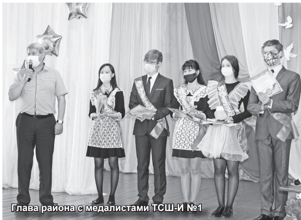
Глава района с медалистами ТОШ-И №1

Трудно переоценить значение школы в образовании, да что говорить, и в воспитании детей. Я больше чем уверена – всех вас рано или поздно притянет снова сюда, ведь только в школе человек может одновременно прожить три этапа становления чело-