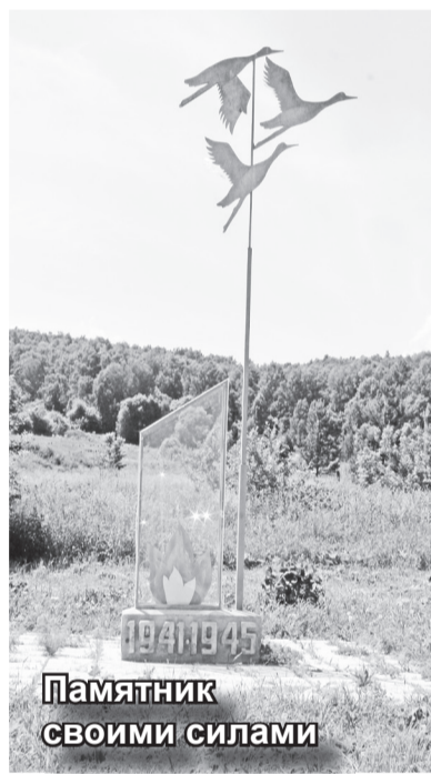
Памятник своими силами

Так как мы юридическая организация, то надо сдавать отчеты. Это, конечно, тоже причина неформальности: необходимо заполнять бумаги, вести их, сдавать. А тратить свое личное время и нервы – мало кому хочется, но это с одной стороны. С другой – все, что мы делаем в рамках ТОСа, мы делаем для себя, а чтобы что-то получить, надо усилия приложить. При таком подходе более спокойно ре-