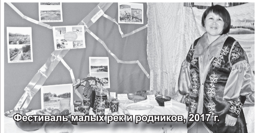
Фестиваль малых рек и родников, 2017 г.

По библиотечной традиции 15 июня отмечается День малых рек и родников Таштыпского района. Традиция эта зародилась в 2015 году. Эта дата была выбрана неслучайно, ведь с 15 мая по 15 июня в России проходит широкомасштабная акция – Единые дни защиты малых рек и водоемов.