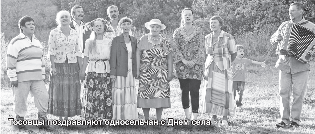
Тосовцы поздравляют односельчан с Днем села

ТОС – территориальное общественное самоуправление. Более 12 лет назад в российском законодательстве появилось положение, предоставляющее гражданам право самостоятельно принимать участие в управлении при решении вопросов местного значения. И многие инициативные, неравнодушные люди такую возможность восприняли с энтузиазмом и начали активно действовать.