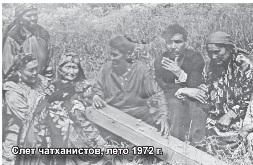
Слет чатханистов, лето 1972 г.